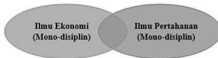
Gambar 2.1 Ekonomi Pertahanan: Irisan antara Ilmu Ekonomi dan Ilmu Pertahanan

Ekonomi pertahanan adalah ilmu ekonomi yang dipadukan dengan ilmu pertahanan dengan kajian masalah-masalah ekonomi suatu negara dengan mempertimbangkan analisis kepentingan dan kedaulatan negara.