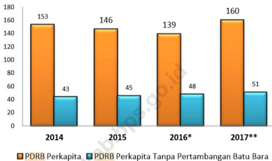
Gambar 2 PDRB Perkapita Kabupaten Paser 2014-2017 (juta rupiah)

memasukkan subsektor pertambangan non migas. PDRB perkapita tanpa batubara sebesar 51 juta rupiah sebagaimana ditunjukkan pada gambar berikut.