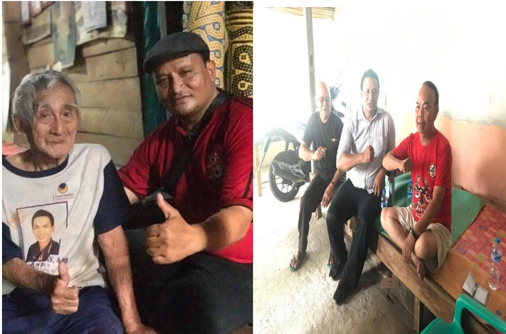
Foto 7 dan 8 : PUN Rumah Betang Ensaid Panjang dan Temenggung Kecamatan Kelam Permai