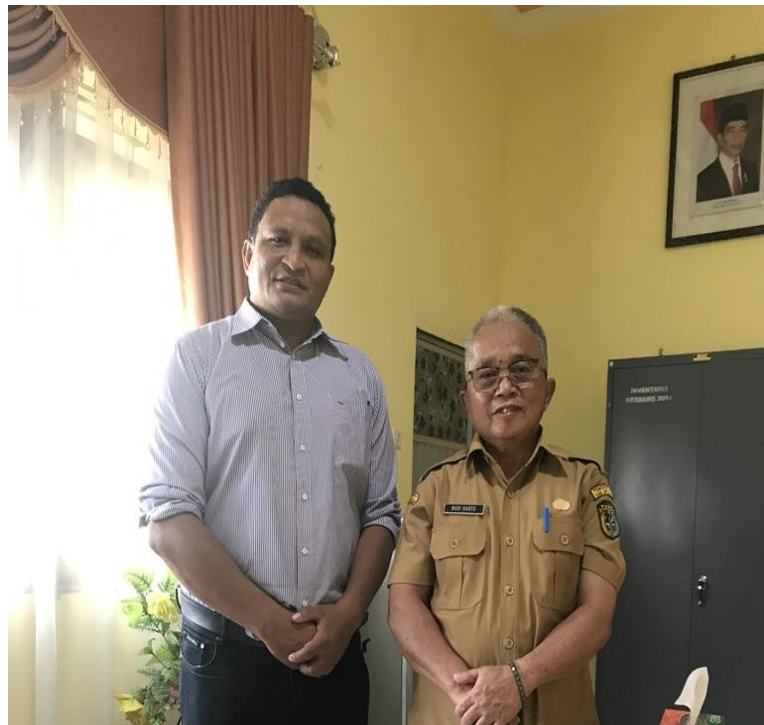
Figure 5: Kepala Badan Kesbangpol Kabupaten Sintang