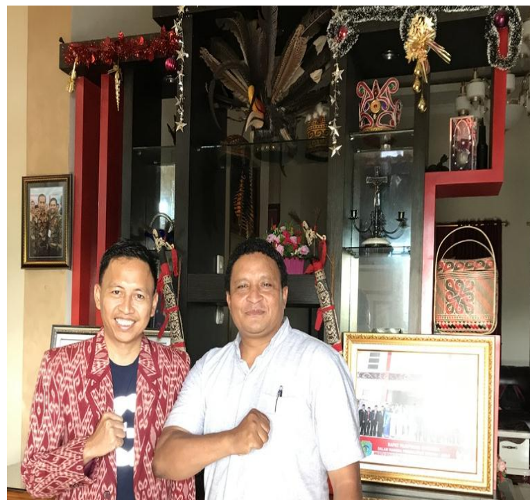
FOTO 4: Ketua DPRD (2014-2019) dan Merangkap Ketua Dewan Adat Kabupaten Sintang