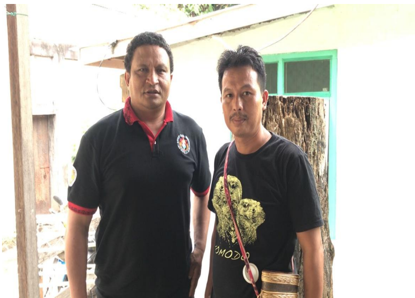
Foto 11: Ketua Harian Aliansi Masyarakat Adat Nusantara Kabupaten Sintang