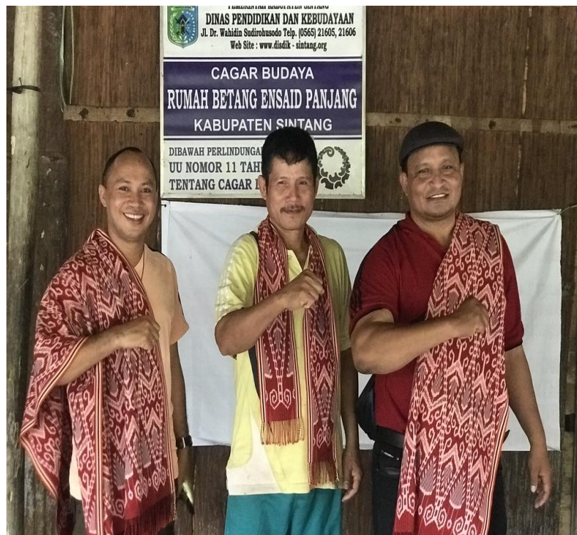
Foto 9: Masyarakat Adat Suku Desa Betang Ensaid Panjang dan Rohaniwan Katolik Ensaid Panjang