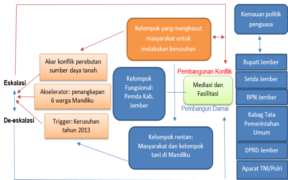
Gambar 4.2 Kerangka Dinamis Pencegahan dan Resolusi Konflik

Dalam buku Resolusi Konflik Jembatan perdamaian terdapat teori kerangka dinamis dan resolusi konflik yang dapat mengurai permasalahan hingga tahap penyelesaian konflik dalam 5 komponen yaitu: