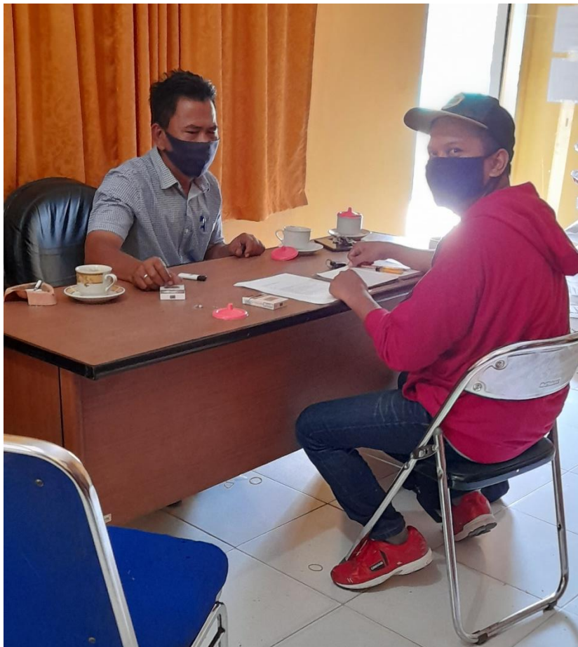
Wawancara Dengan Kepala Desa Air Hitam