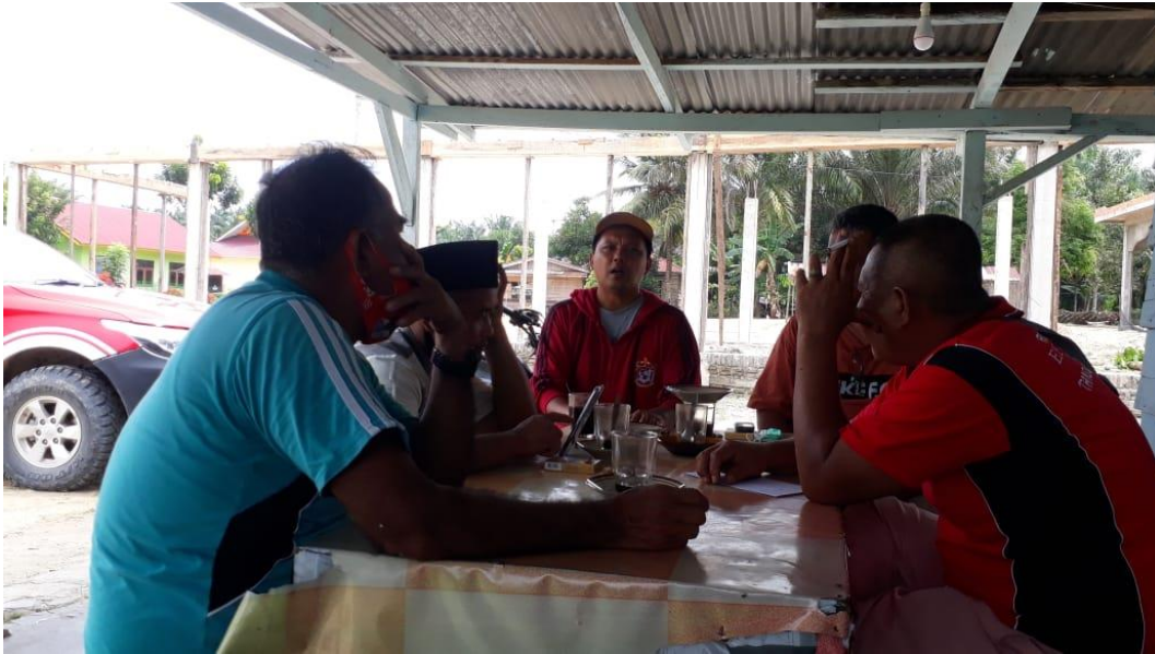
Wawancara Dengan Sekretaris Desa Bagan Limau dan Ketua KTHK Desa Bagan Limau