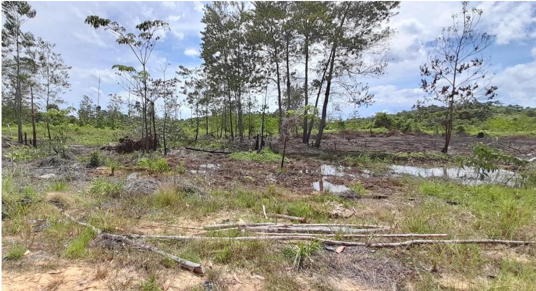
Areal Kemitraan Konservasi Desa Bagan Limau