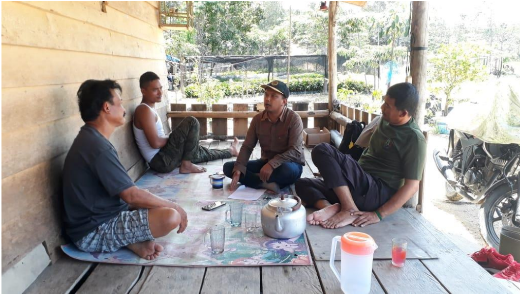
Wawancara Dengan Anggota KTHK Desa Bagan Limau