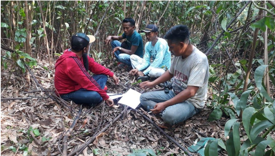
Wawancara Dengan Calon Peserta Kemitraan Konservasi Desa Air Hitam