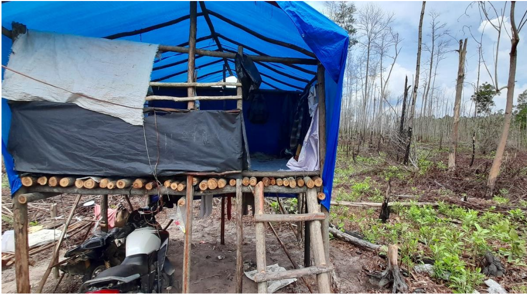
Observasi Areal Pembukaan Lahan Baru di Kawasan TNTN