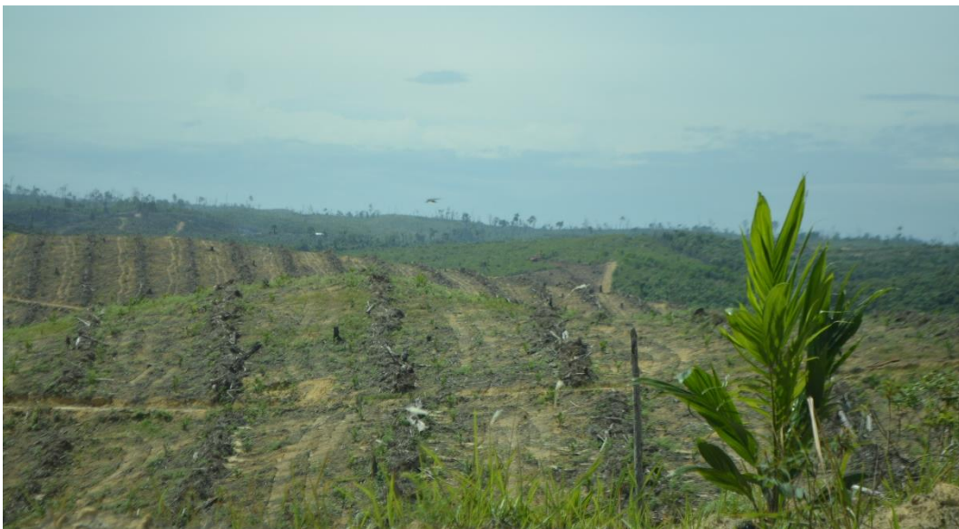
Kawasan TNTN Yang Tertanami Kelapa Sawit