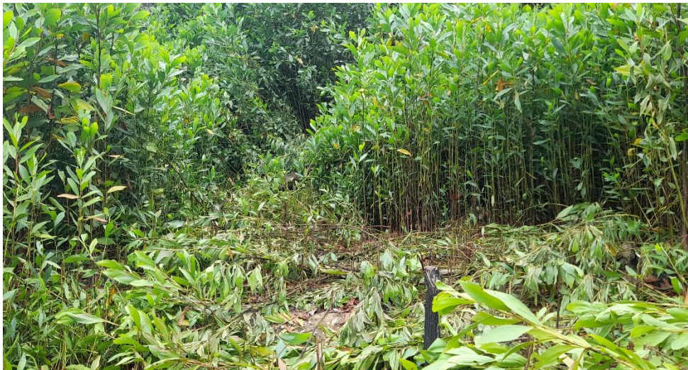
Observasi Areal Pembukaan Lahan Baru di Kawasan TNTN