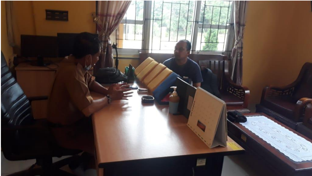
Wawancara Dengan Kepala Desa Lubuk Kembang Bunga