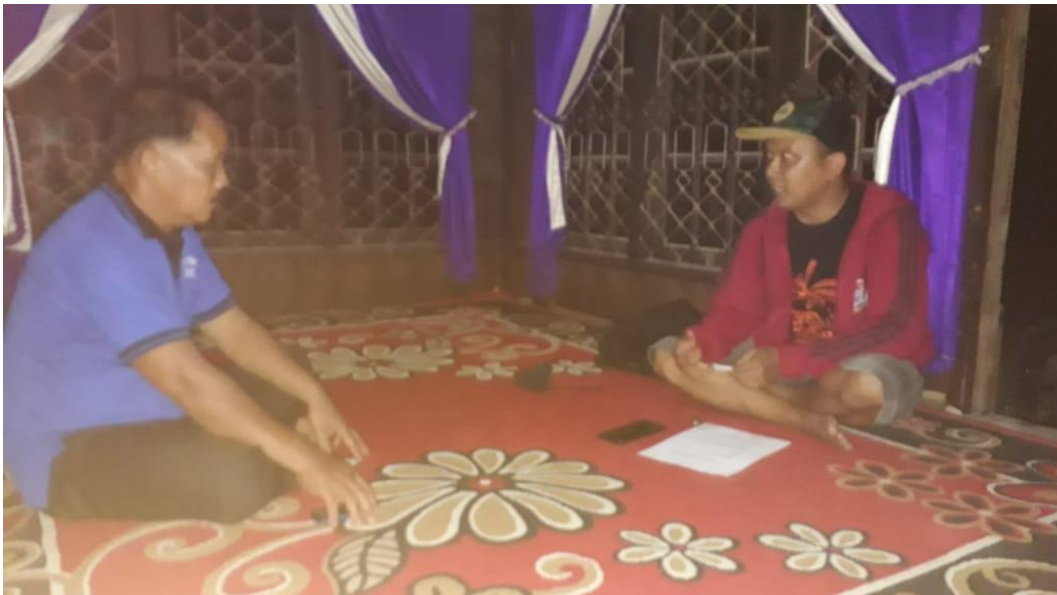
Wawancara Dengan Tokoh Adat/Tokoh Masyarakat Desa Lubuk Kembang Bunga