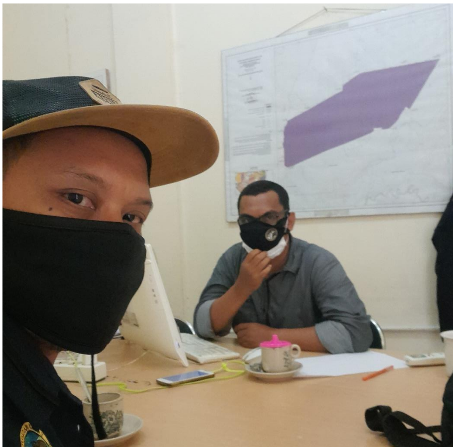
Wawancara dengan Direktur Yayasan Taman Nasional Tesso Nilo