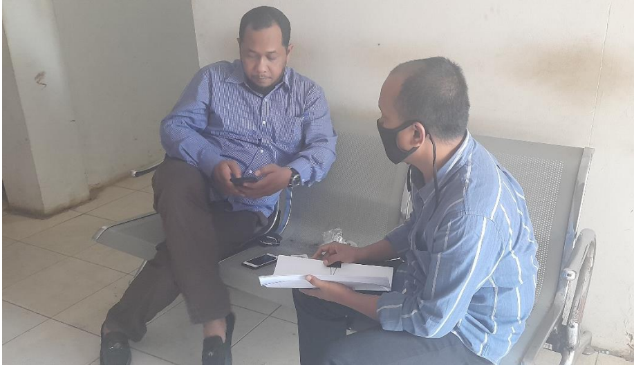
Wawancara dengan Kepala SPTN Wilayah I Lubuk Kembang Bunga, Balai Taman Nasional Tesso Nilo