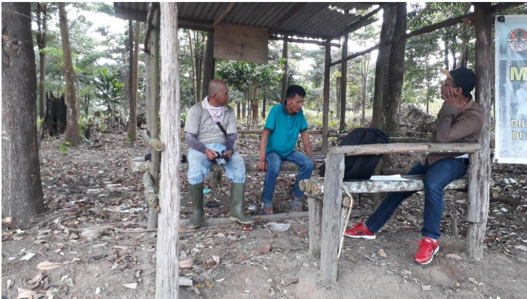
Wawancara Dengan Ketua RW Pondok Kempas