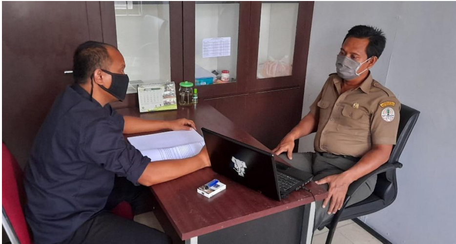
Wawancara Dengan Kepala Urusan Pengamanan dan Perlindungan Hutan Balai Taman Nasional Tesso Nilo