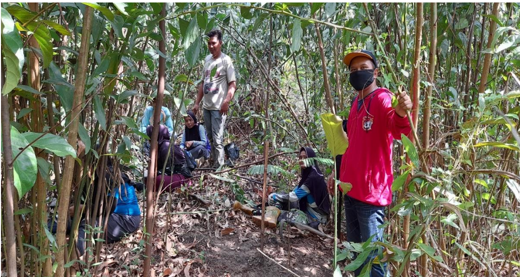
Observasi Calon Areal Kemitraan Konservasi di Air Hitam