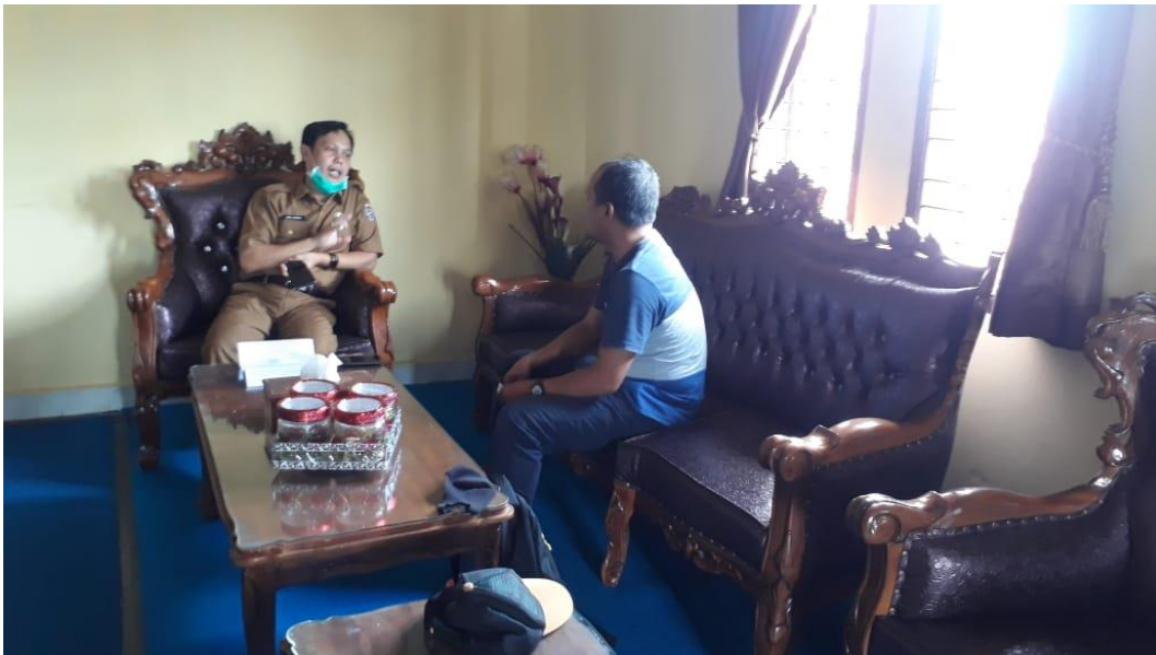
Wawancara Dengan Camat Ukui