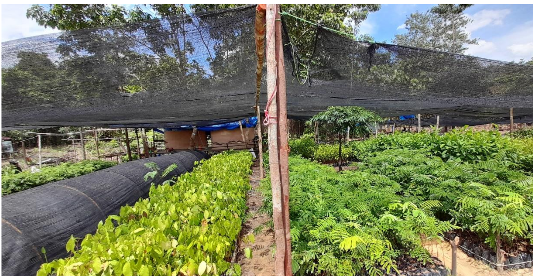
Persemaian Tanaman Kehidupan Untuk Kemitraan Konservasi di Desa Bagan Limau