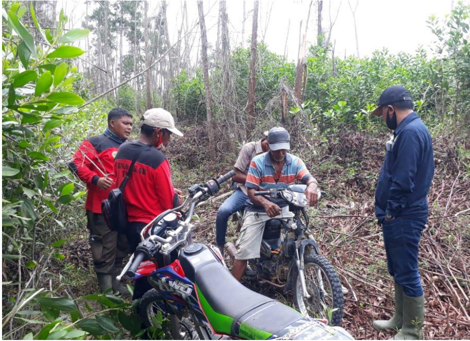
Wawancara Dengan Masyarakat Penggarap Lahan di TNTN