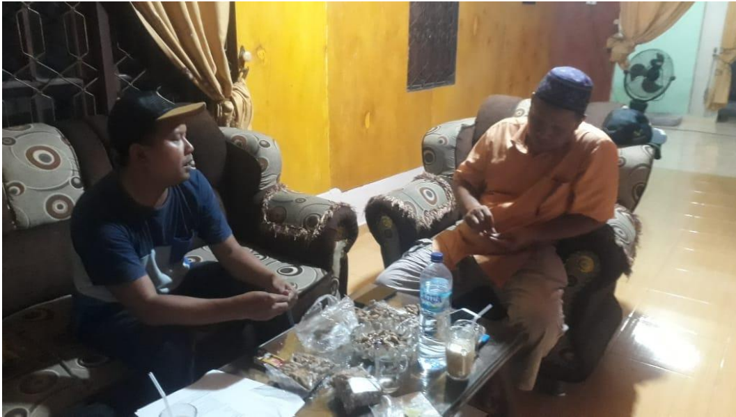
Wawancara Dengan Tokoh Masyarakat/Ketua FMTN