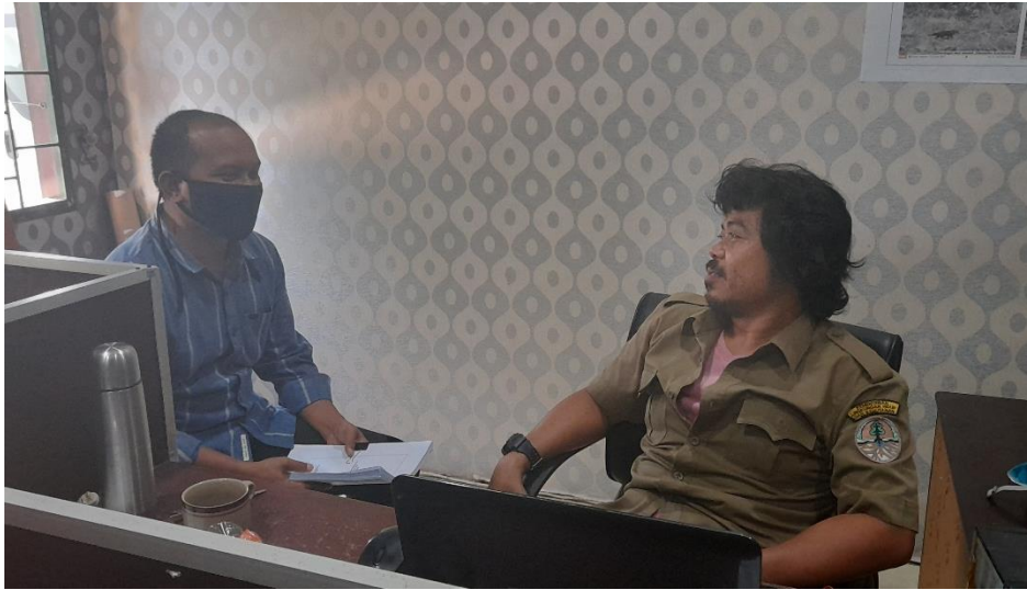
Wawancara dengan Kepala Urusan Teknis dan Pemetaan, Balai Taman Nasional Tesso Nilo