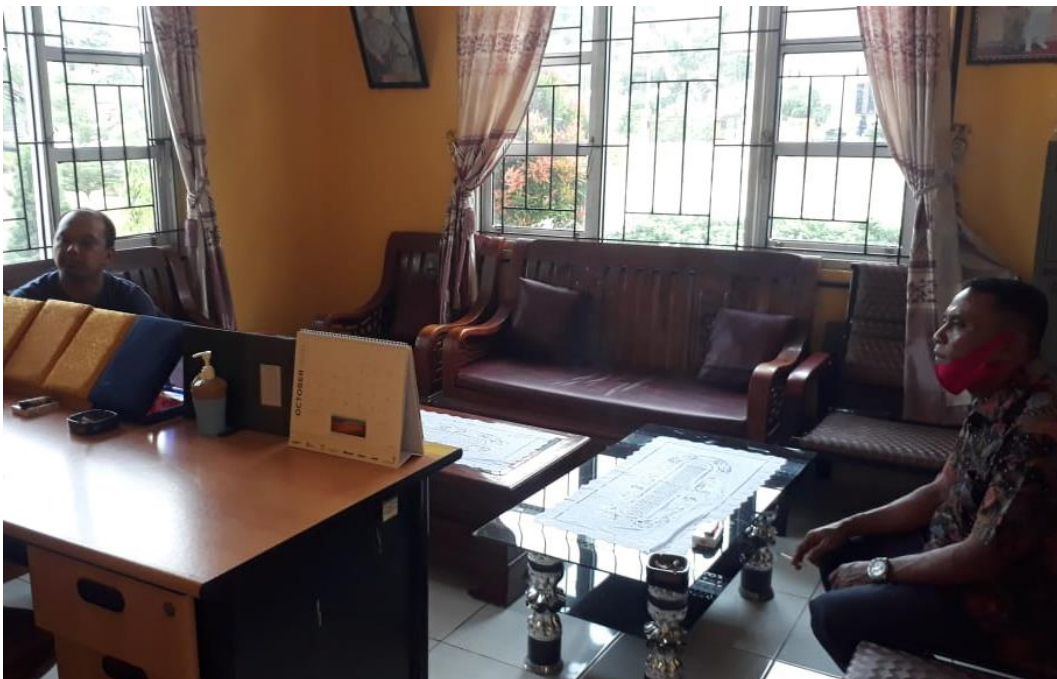
Wawancara Dengan Batin Muncak Rantau