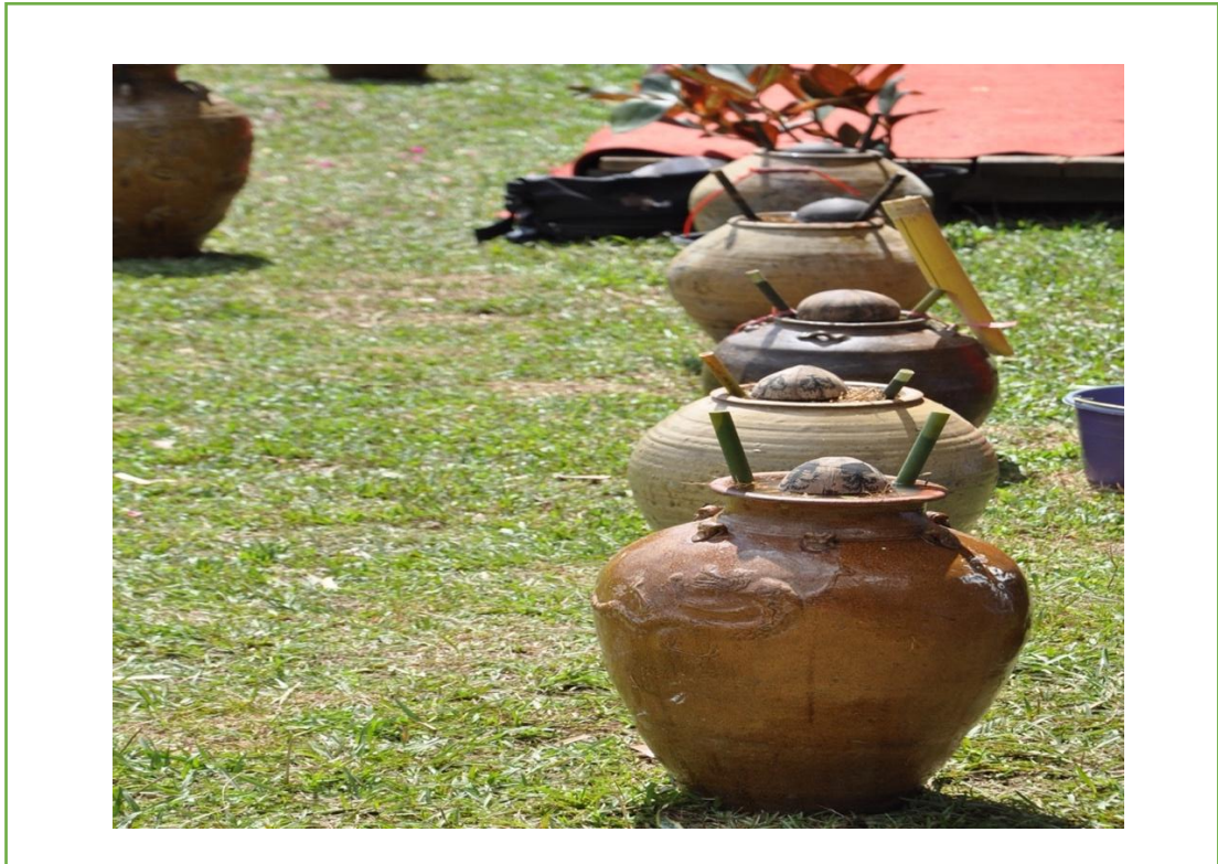
Gambar 6: Tempayan, Wadah Tuak, minuman tradisional Dayak