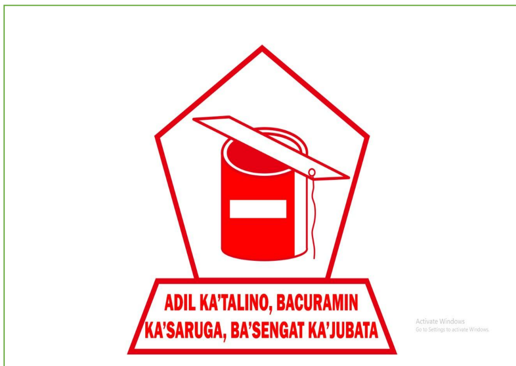
Gambar 7: Simbol Peradilan Dayak