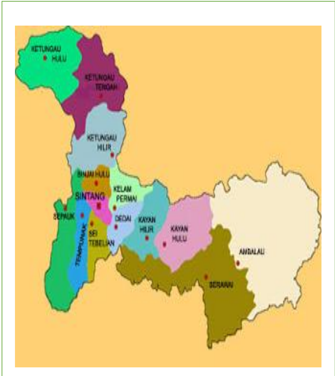
Gambar 4 : Peta Kabupaten Sintang

Sumber: Kabupaten Sintang Dalam Angka 2019