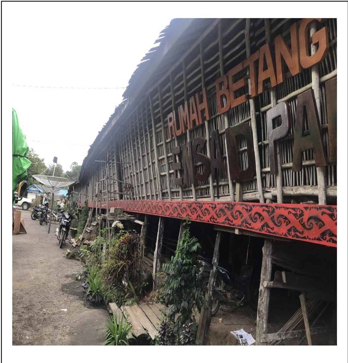
Gambar 8: Rumah Betang Suku Adat Desa