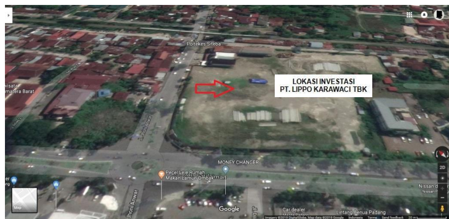
Gambar 4.1 Lokasi Rencana Investasi PT. Surya Persada Lestari

utara berbatasan dengan rumah penduduk dan rel kereta api, sebelah timur laut berbatasan dengan rumah penduduk, sebelah timur berbatasan dengan bangunan TK, SD dan SMP Al-Azhar 32 Padang, dan sebelah selatan berbatasan dengan Jalan Khatib Sulaiman. Jarak dari lokasi rencana investasi PT. Surya Persada Lestari ke pinggiran pantai yang berhadapan dengan Samudera Hindia adalah \pm 1 KM.