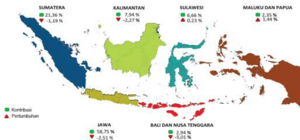
Gambar 1.2 Pertumbuhan dan Kontribusi PDRB menurut Pulau Tahun 2020

Data dari BPS juga menunjukkan dampak pandemi COVID-19 dirasakan dengan level kontraksi pertumbuhan yang bervariasi antarpulau. Kelompok pulau yang mengalami kontraksi pertumbuhan ( c-to-c ) meliputi Pulau Bali dan Nusa Tenggara sebesar -5,01 persen; Pulau Jawa sebesar -2,51 persen; Pulau Kalimantan sebesar -2,27 persen; dan Pulau Sumatera sebesar 1,19 persen. Sebaliknya, dampak COVID-19 relatif tidak terlalu parah pada kelompok pulau yang mengalami peningkatan pertumbuhan yang meliputi Pulau Sulawesi tumbuh sebesar 0,23 persen dan Pulau Maluku dan Papua sebesar -1,44 persen.