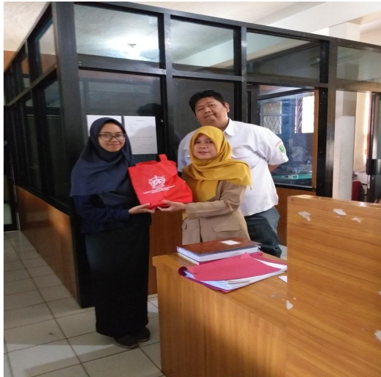
Peneliti Bersama pihak Kesatuan Bangsa dan Politik Provinsi Sumatera Selatan