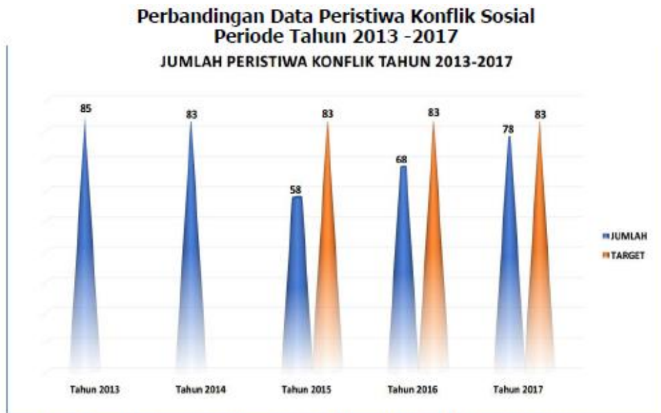
Gambar 1.1 Perbandingan Peristiwa Konflik Sosial Berdasarkan Sumber Konflik Sumber : LAPKIN Dirjen Polpum 2017

Sumber data: Direktorat Kewaspadaan Nasional Bulan Desember 2017