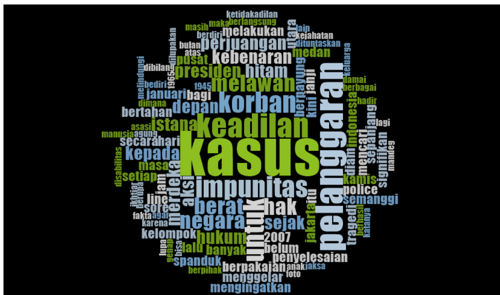
Gambar 4.1 Kata Kunci Tujuan Aksi Kamisan

Kegiatan awal paguyuban ini adalah sosialisasi HAM ke sekolah-sekolah, menjenguk Presiden Soeharto waktu beliau sakit, membuat buku panduan berwawasan HAM untuk Sekolah Menengah Atas (SMA) dan workshop sampai kemudian melakukan advokasi dan Aksi Kamisan. Berdasarkan penjelasan narasumber KK 1, Aksi Kamisan adalah aksi diam, diam bukan menyerah tapi aksi diam untuk melawan impunitas. Aksi diam merupakan cara bertahan untuk mencari kebenaran, keadilan, menolak lupa dan melawan impunitas. Selain itu, hasil analisis terhadap 167 surat JSKK kepada presiden setiap minggunya sejak 2014-2018 menunjukkan beberapa kata kunci terkait tujuan Aksi Kamisan sebagaimana gambar di bawah ini.