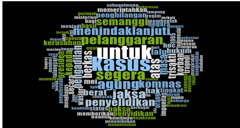
Gambar 4.1 Kata Kunci Tuntutan Aksi Kamisan

Berdasarkan analisis surat kepada presiden, ditemukan tuntutan-tuntutan sebagai berikut yang dapat dijadikan pertimbangan kebijakan: