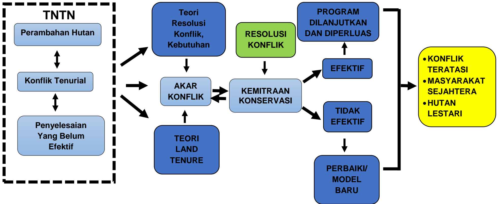
Gambar 2.2. Diagram Kerangka Berpikir