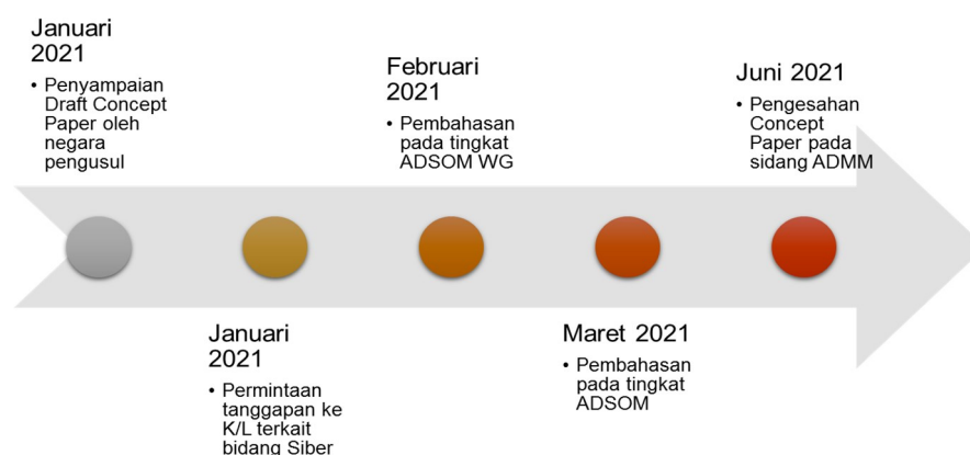
Bagan 4.3 Proses Pembentukan Forum Kerja Sama bidang Siber

Perlunya keterlibatan dari kementerian/lembaga lain dalam kebijakan kerja sama pertahanan juga diamati oleh Peneliti pada saat melaksanakan observasi terhadap proses pembentukan forum kerja sama terkait bidang siber, ASEAN Cyber Defence Network yang membangun koneksi antar pusat pertahanan siber negara anggota ASEAN dan ASEAN Cybersecurity and Information Center of Excellence yang berfungsi sebagai forum kerja sama multilateral dalam menghadapi ancaman terhadap serangan siber, disinformasi dan misinformasi. Kedua forum kerja sama ini ditetapkan dalam 15th Anniversary of the ADMM yang dilaksanakan secara virtual pada tanggal 15 Juni 2021, setelah melalui serangkaian proses penetapan yang berlangsung lama.