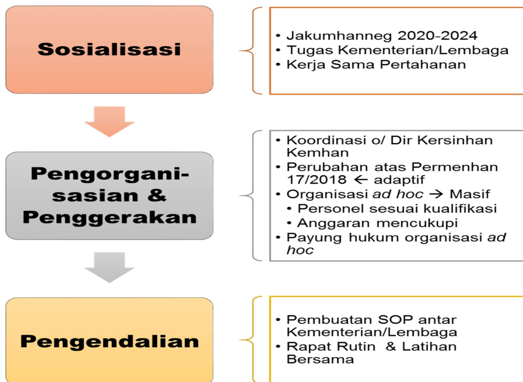
Bagan 4.6 Model Sinergitas Kelembagaan dalam Implementasi Kebijakan Kerja Sama Pertahanan

Berdasarkan hasil analisa terhadap data penelitian yang ada, Peneliti kemudian mengusulkan suatu model dari implementasi kebijakan kerja sama pertahanan (lihat gambar 4.6). Model ini ditawarkan tidak saja untuk digunakan dalam membangun keamanan komprehensif di kawasan Asia Tenggara saja, tapi dapat digunakan secara lebih luas pada lingkup kerja sama pertahanan lainnya.