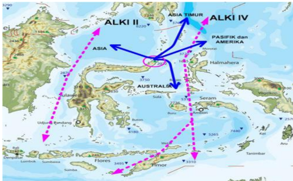
Gambar 4.2 Peta Posisi Sulawesi Utara Sebagai Gerbang Utara Indonesia