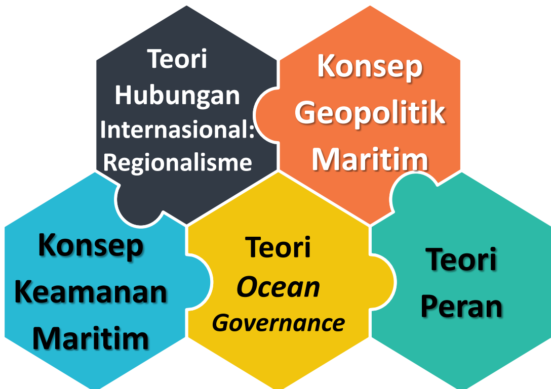
Gambar 2.1 Teori dan Konsep yang Digunakan Peneliti dalam Tesis

Tinjauan pustaka dalam penelitian ini menjabarkan teori dan konsep yang berkaitan dengan permasalahan penelitian, dimana didukung oleh penelitian terdahulu sebagai pembanding dan menjaga orisinalitas penyusunan penelitian.