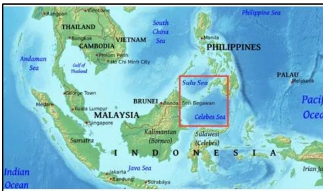
Gambar 1.1 Peta Laut Sulu dan Laut Sulawesi yang berada diantara Indonesia – Malaysia – Filipina

Laut Sulu – Sulawesi juga merupakan salah satu jalur perdagangan potensial yang ada di wilayah Asia Tenggara. Selain itu jalur ini telah menjadi jalur alternatif untuk dilalui kapal-kapal dari Indonesia menuju ke Asia Timur selain melalui jalur Selat Malaka. Wilayah perairan yang terdapat di antara tiga negara besar di wilayah Asia Tenggara ini memiliki potensi-potensi yang kemudian terancam apabila tidak mendapatkan perhatian yang serius. Kawasan ini merupakan salah satu kawasan yang rawan dijadikan kawasan sindikat kejahatan internasional. Kejahatan lintas negara ini meliputi peredaran narkoba, penyeludupan senjata, pembajakan dan terorisme. Banyak kelompok-kelompok kriminal yang memanfaatkan kelemahan birokrasi suatu negara agar lolos dari jeratan hukum dan mengembangkan operasi mereka ke ranah internasional (Emmers, 2003).