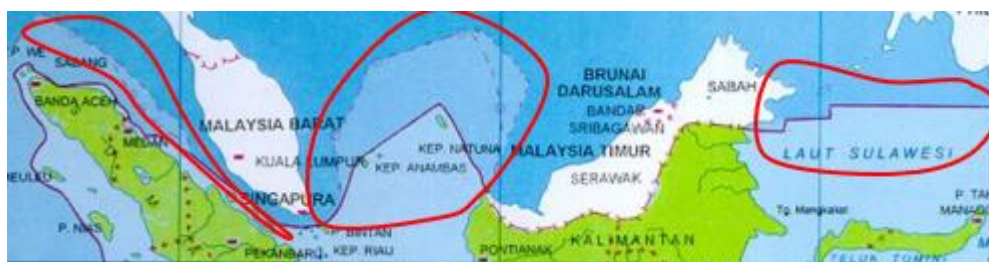
Gambar 1.2 Gambar Wilayah Indonesia yang Rawan IUU fishing dari KIA Berbendera Malaysia

menggunakan cara-cara tradisional. Hal ini telah menyebabkan mereka melanggar wilayah penangkapan ikan di wilayah negara lain termasuk wilayah laut Malaysia. Kealpaan teknologi GPS ( Global Positioning System ) membuat mereka tidak mengetahui keberadaan batas wilayah negara. (Putri, 2016). Berikut dalam Gambar 1.2, peta wilayah perairan yang sering menjadi tempat pelanggaran batas wilayah penangkapan ikan baik oleh kapal ikan Indonesia maupun kapal penangkap ikan berbendera Malaysia.