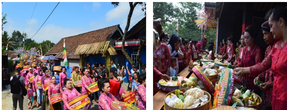
Gambar 4.8 Tenongan Ibu-ibu Dusun Giyanti

Arak-arakan tenong atau tenongan yang dibawa oleh ibu-ibu menampilkan kekompakan masyarakat (lihat Gambar 4.8). Dalam hal ini selama arak-arakan menuju Sanggar Kertojanti dan menunggu tenong dibariskan, ibu-ibu saling bercerita isi tenong masing-masing dan menyisahkan sedikit makanan untuk saling mencicipi. Di sinilah terlihat keikhlasan masyarakat Giyanti untuk berbagi.