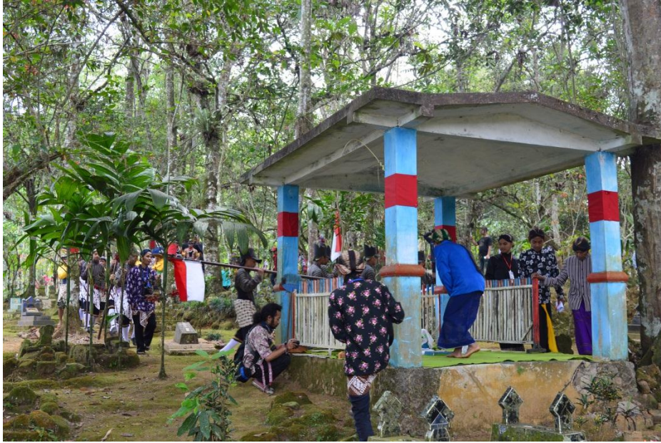
Gambar 4.1 Prosesi Ziarah Makam Pendiri Dusun Giyanti Pada Tradisi Nyadran 2017