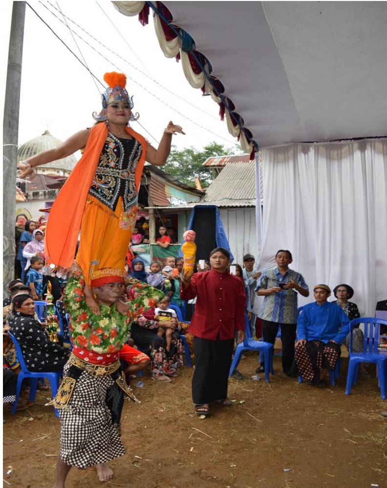
Gambar 4.4 Tari Lengger Pada Tradisi Nyadran 2017