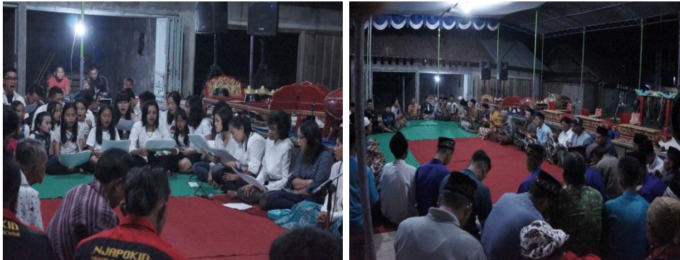
Gambar 4.12 Pembacaan Doa secara Katolik dan Islam

Malam hari setelah acara inti Tradisi Nyadran, masyarakat baik yang muslim maupun non muslim berkumpul bersama untuk mendengarkan doa yang secara bergantian dibacakan oleh perwakilan setiap agama (lihat Gambar 4.12). Ketika masyarakat khusus mendengarkan pembacaan doa dari agama lain, di situ terdapat nilai saling menghargai. Kerukunan antarumat beragama di Dusun Giyanti tercermin dalam kegiatan tersebut.