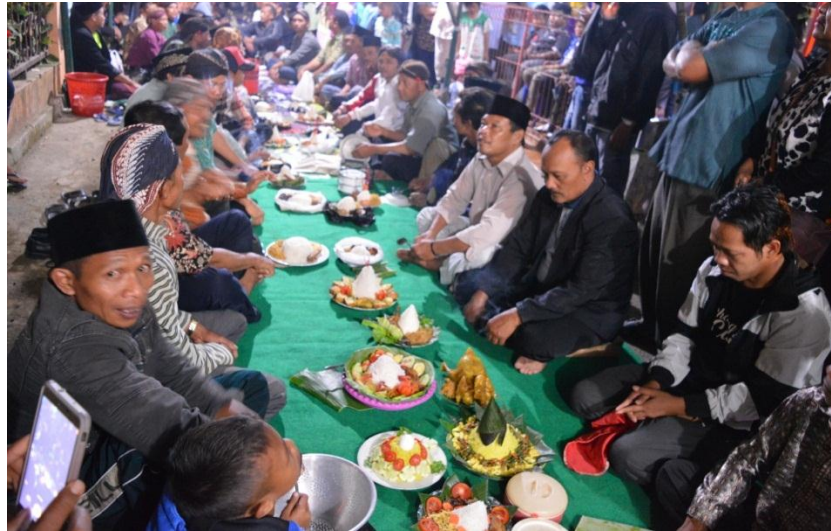
Gambar 4.13 Salametan Kobol-Kobol