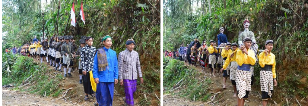
Gambar 4.7 Ziarah Makam Leluhur Pendiri Dusun Giyanti

menyadari bahwa masyarakat Giyanti adalah sama berasal dari satu nenek moyang yaitu pendiri dusun tersebut. Sehingga, perselisihan yang diakhibatkan karena adanya perbedaan dapat diselesaikan dengan cara kekeluargaan.