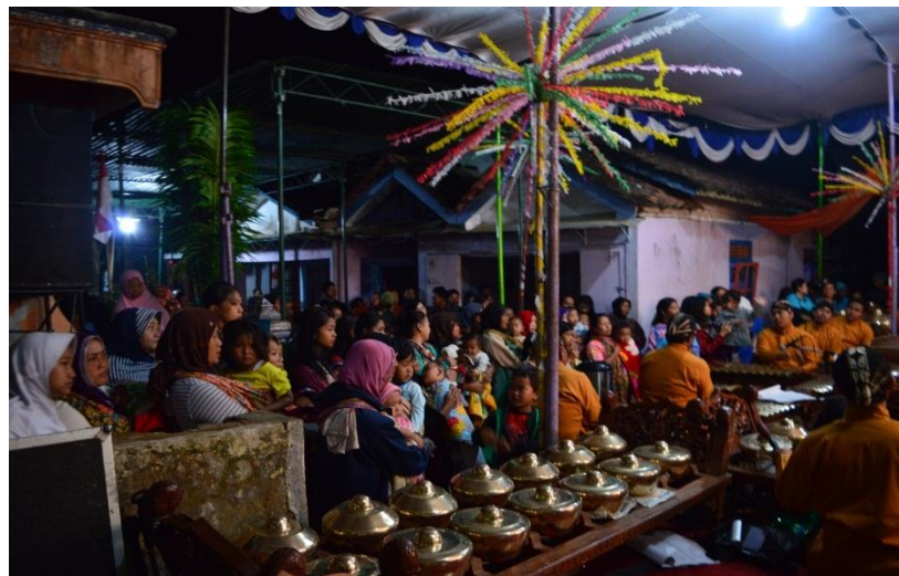
Gambar 4.14 Antusiasme Masyarakat Giyanti Menyaksikan Wayang

Pagelaran wayang menjadi hiburan yang ditunggu-tunggu karena pagelaran ini diadakan setiap dua tahun sekali (lihat Gambar 4.14). Pagelaran wayang ini berkaitan dengan kecintaan masyarakat Giyanti terhadap budaya Jawa yang salah satunya berupa kisah atau cerita yang dipentaskan melalui media wayang kulit.