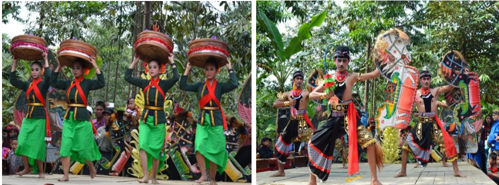
Gambar 4.9 Contoh Kesenian dalam Acara Inti Tradisi Nyadran

Kehadiran para pejabat dari lingkungan Pemerintahan Kabupaten Wonosobo merupakan wujud keperdulian sekaligus penghargaan atas berlangsungnya Tradisi Nyadran di Giyanti. Begitupun dengan kehadiran dari pelaku seni yang berasal dari luar Dusun Giyanti untuk ikut berpartisipasi memeriahkan Tradisi Nyadran (lihat Gambar 4.9). Sedangkan, pembacaan sejarah dusun yang selalu dilaksanakan adalah sarana untuk memperkenalkan Dusun Giyanti kepada masyarakat lain di luar Giyanti yang hadir sekaligus mengingatkan kembali masyarakat Giyanti agar tidak melupakan jasa-jasa leluhur pendiri dusun.