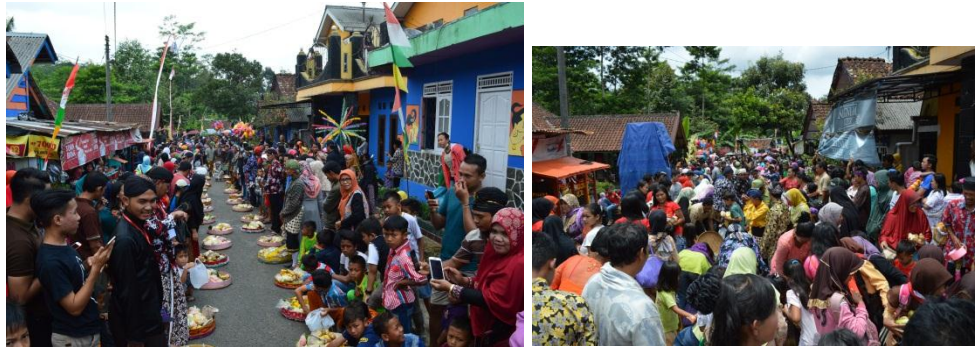
Gambar 4.10 Rebutan Makanan dalam Tenong

selanjutnya akan makan bersama dengan makanan seadanya tanpa membeda-bedakan latar belakang maupun asal. Nilai kebersamaan yang kuat ketika semua masyarakat Giyanti ikut berbaur dengan seluruh yang hadir makan bersama duduk di pinggir jalan dan saling berbagi satu sama lain.