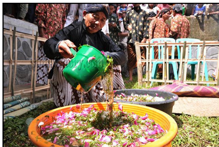
Gambar 4.11 Air Bunga dalam Acara Inti Tradisi Nyadran

Bukan sebagai bentuk syirik atau musrik, masyarakat Giyanti mengambil air yang telah didoakan (lihat Gambar 4.11). kegiatan ini lebih bertujuan untuk mencari berkah. Pada saat mengambil airpun masyarakat tertib menganti dan bergantian, ada pula yang saling berbagi ketika ada yang tidak mendapatkan airnya. Budaya antri dan tertib ini yang patut dicontoh dalam kegiatan apapun.