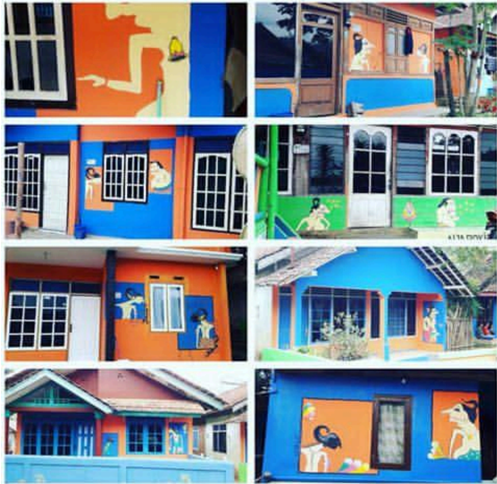
Gambar 4.5 Pemandangan Kampung Wayang, Giyanti