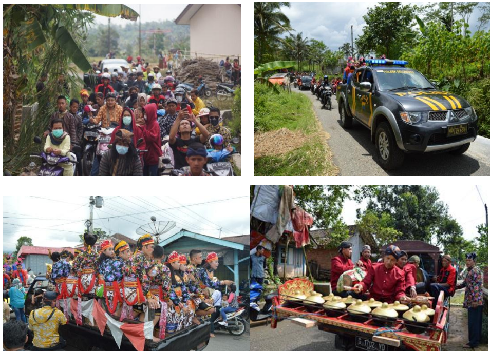
Gambar 4.6 Pawai Budaya dalam Tradisi Nyadran 2017