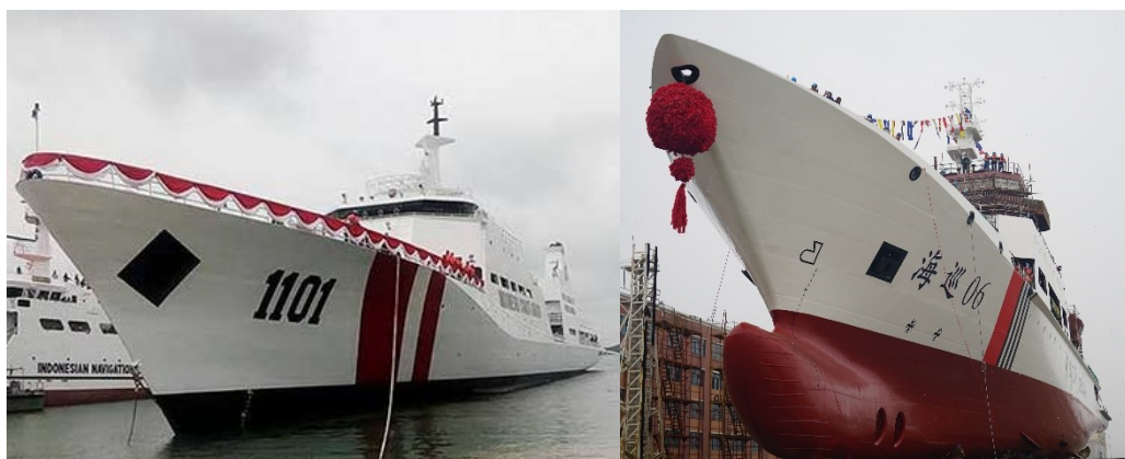
Gambar 2.6 Perbedaan Struktur Lambung Kapal Patroli Bakamla RI (kiri) dan Kapal Patroli Coast Guard RRC (kanan)

Bentuk ini diadopsi pula oleh kapal Coast Guard RRC maupun kapal Milisi Maritim ( Maritime Militia ) Vietnam. Hal ini menjadi suatu bentuk ancaman baru bagi kapal Bakamla RI yang beroperasi di Laut Natuna, mengingat kedua negara tersebut sering mengoperasikan kapal-kapal patrolinya hingga kawasan Laut Natuna. Apabila dibandingkan, kapal patroli Bakamla RI belum menggunakan struktur lambung kokoh sebagaimana kapal Coast Guard RRC maupun kapal Milisi Maritim Vietnam sehingga dapat berisiko saat terjadi benturan ( ramming ).