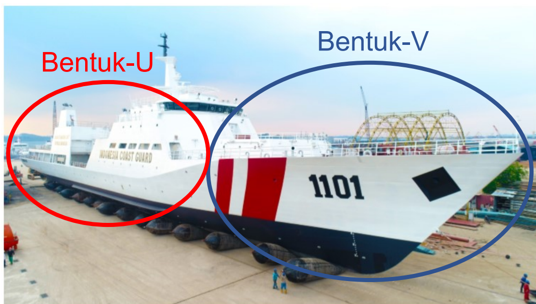
Gambar 2.4 Lambung KN Tanjung Datu

Lambung Kapal adalah bagian kapal yang berguna untuk memberikan daya apung (Schneekluth, et al., 1998 sebagaimana dikutip dalam Satoto, 2019). Bentuk Lambung Kapal memberikan pengaruh terhadap kecepatan dan stabilitas kapal. Sebagaimana kapal patroli pada umumnya, Kapal Patroli Bakamla RI khususnya yang beroperasi di Laut Natuna menggunakan bentuk Lambung Kapal Kombinasi, yaitu Bentuk-V di bagian haluan hingga ke bagian tengah dan Bentuk-U di bagian tengah hingga ke bagian buritan. Hal ini bertujuan menggabungkan keunggulan dari kedua bentuk tersebut. Bentuk-V memiliki keunggulan dalam hal kecepatan karena karakteristik seakeepingnya (Bashir et al., 2011) sedangkan Bentuk-U memiliki keunggulan dalam hal ketahanan atau stabilitas kapal (Novita et al., 2007).