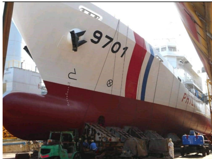
Gambar 2.7 Lambung Kapal Coast Guard Filipina

Selain kapal Coast Guard RRC dan kapal Milisi Maritim Vietnam, kapal Coast Guard Filipina juga sudah menggunakan struktur lambung kokoh. Hal ini dapat terlihat pada kapal berjenis Multi Role Response Vessel (MRRV) sepanjang 94 m yang dipesan dari Galangan Kapal Shimonoseki milik Mitsubishi Shipbuilding Co. Ltd., Jepang, yang direncanakan akan mulai beroperasi pada bulan Maret tahun 2022 (Noriega, 2021). Sebagaimana Indonesia, Filipina juga merupakan negara yang terdampak oleh asertivitas Cina dalam mengklaim Nine Dash Line di Laut Cina Selatan sehingga dapat disimpulkan bahwa pemilihan struktur lambung ini oleh Coast Guard Filipina dilakukan berdasarkan ancaman yang sama.