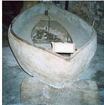
Gambar 2.10 Perahu ciptaan Joseph Louis Lambot