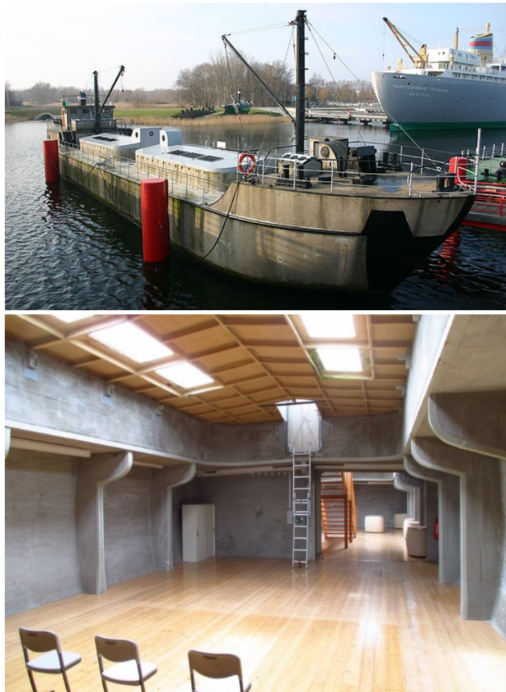
Gambar 2.11 Kapal M/V Capella (atas) dan Interiornya (bawah)