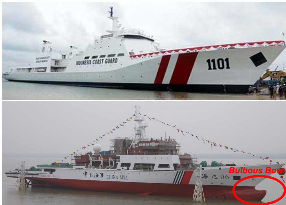
Gambar 2.8 Perbedaan Bentuk Haluan Lambung Kapal Patroli Bakamla RI (atas) dan Kapal Coast Guard RRC (bawah)

dalam Romadhoni, 2017). Trim pada kapal diakibatkan oleh gelombang yang ditimbulkan saat kapal melaju di permukaan air akibat adanya kontak antara Lambung Kapal pada bagian haluan dengan permukaan air. Semakin tinggi kelajuan kapal, gelombang yang ditimbulkan akan semakin panjang. Keberadaan Bulbous Bow akan mengurangi panjang gelombang yang dihasilkan sehingga mengurangi trim pada Lambung Kapal.