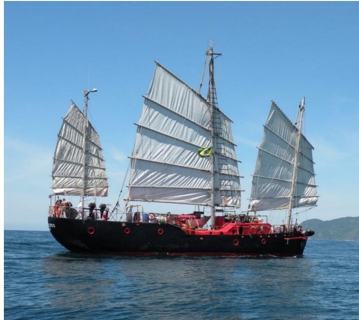
Gambar 2.12 Kapal Heraclitus

Konstruksi di Indonesia (Gunawan, 2020). Kelemahan lainnya adalah Ferrocement kurang resisten terhadap benturan benda runcing, walaupun Ferrocement tetap memiliki keunggulan terhadap material lain dalam hal biaya konstruksi (biaya material + biaya pekerja), resistansi terhadap api, dan kemudahan dalam reparasi (Whang, 1972).