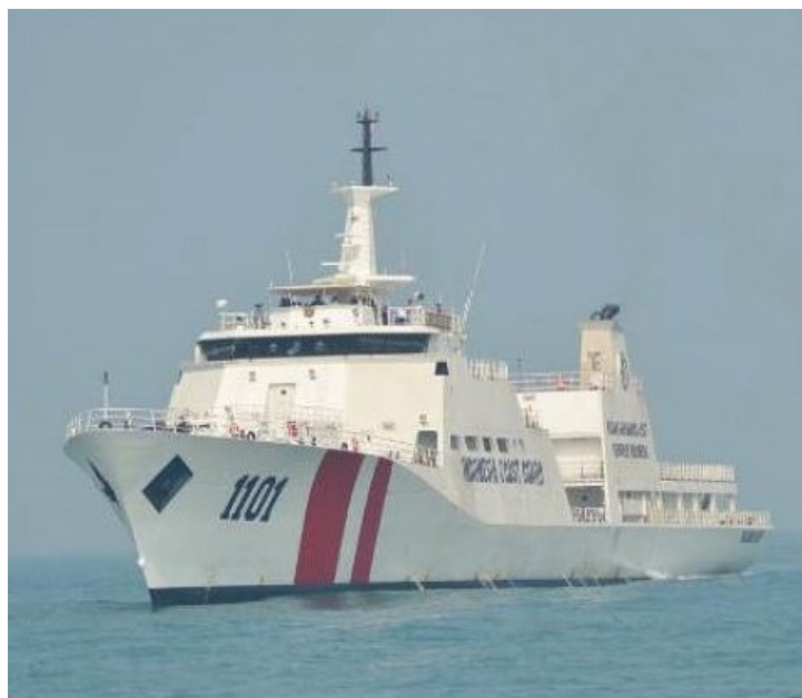
Gambar 2.3 KN Tanjung Datu, Kapal Patroli Bakamla RI di Laut Natuna

juta km 2 dengan garis pantai sepanjang 95.181 km (Pregiwati, 2019, Siaran Pers Nomor: SP204/SJ.04/VIII/2019). Dari total 10 buah Kapal Besar yang dimiliki Bakamla RI, hanya 4 kapal yang beroperasi di Zona Maritim Barat termasuk Laut Natuna. Selebihnya terbagi pada Zona Maritim Tengah (3 buah) dan Zona Maritim Timur (3 buah) (Gunawan, 2020). Sementara itu tidak sembarang kapal dapat melakukan operasi patrol di Laut Natuna. Kapal tersebut harus memiliki ukuran besar ( \geq 80 m) sehingga memiliki resistansi terhadap gelombang-gelombang tinggi ( > 5 m) yang lazim terdapat di perairan Natuna. Di samping itu, kapal juga harus memiliki resistansi terhadap benturan dengan kapal-kapal pelaku pelanggaran hukum yang biasanya menabrakkan diri terhadap Kapal Patroli yang melintas (Mamahit, 2020). Oleh karena itu, persoalan yang harus diselesaikan adalah bagaimana menemukan konstruksi kapal yang dapat diproduksi dalam waktu relatif singkat dengan biaya produksi yang lebih rendah sehingga dapat segera memenuhi armada Kapal Patroli Bakamla RI pada Operasi Patroli di Laut Natuna.