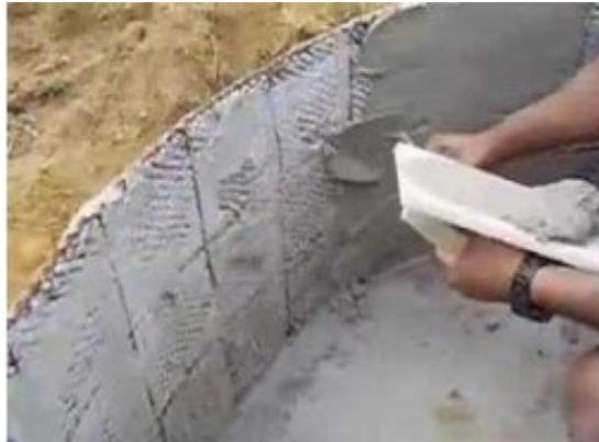
Gambar 2.9 Konstruksi Ferrocement