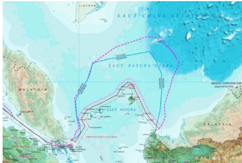
Gambar 2.2 Peta Wilayah Laut Natuna