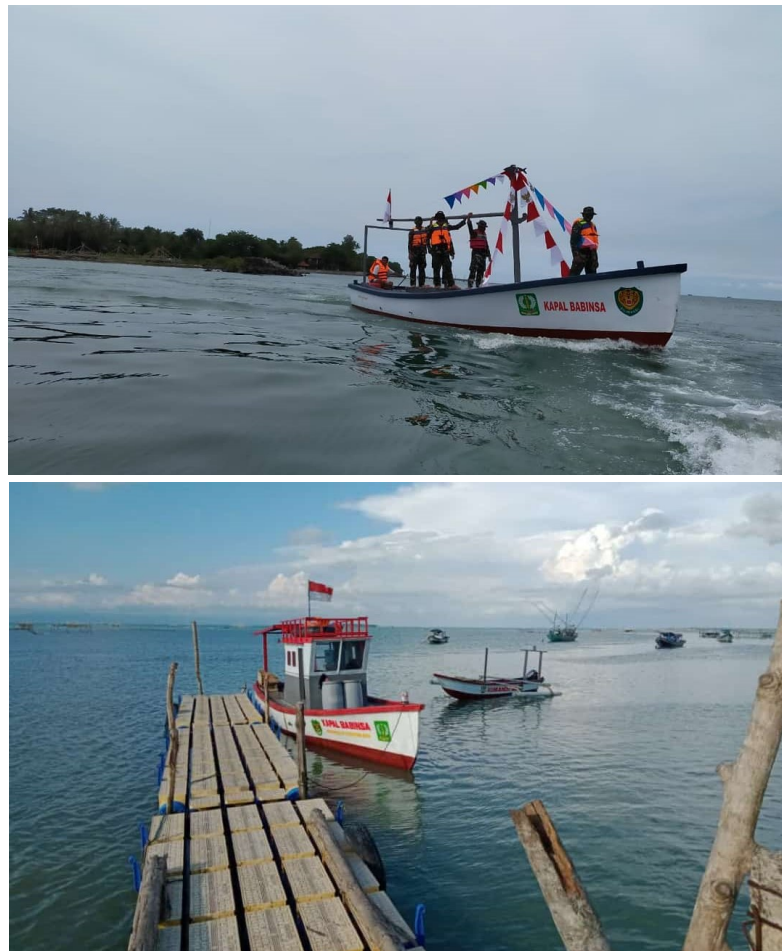
Gambar 2.13 Kapal Merah Putih I (atas) dan II (bawah) buatan PT Carita Boat Indonesia