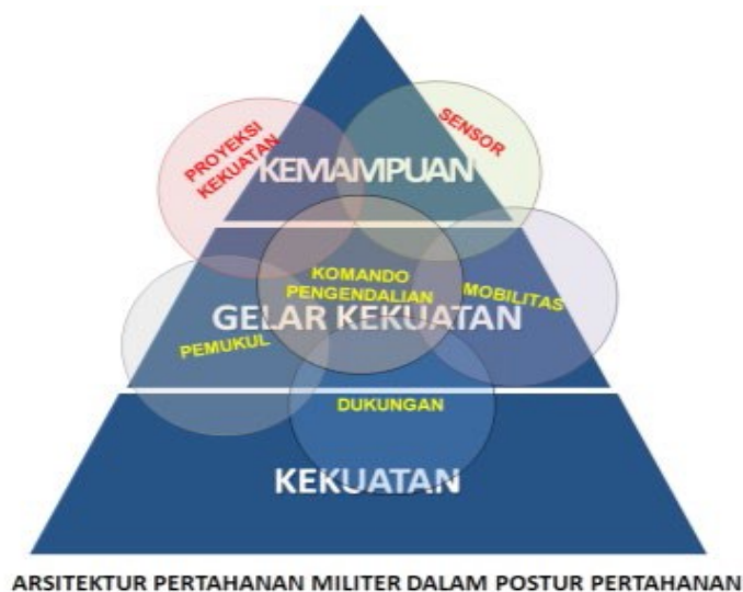
Gambar 1.1 Arsitektur dalam postur Pertahanan

Perkembangan teknologi dan ilmu pengetahuan merupakan bagian utama dalam penggerak untuk terwujudnya sebuah perubahan. Ilmu pengetahuan dan teknologi dapat dikatakan sebagai unsur kemajuan dari sebuah peradaban manusia sekarang. Indonesia melalui Minimum Essential Force (MEF) tahun 2010-2025 melakukan kegiatan besar-besaran dalam rangka menguatkan sistem pertahanan negara dan keamanan nasional, dengan memproduksi serta membeli Alat Peralatan Pertahanan dan Keamanan (Alpahankam) ( Permenhan No 23 thn 2016 tentang Pembinaan Industri Pertahanan ). Indonesia sedang giat melakukan pengembangan dan memproduksi Alpahankam sebagai usaha untuk membawa kemandirian di Industri Pertahanan. Hal ini sesuai dengan tujuh program Alutsista nasional dalam rencana. Nawacita Pemerintah ( Postur Pertahanan Negara, 2015 ).