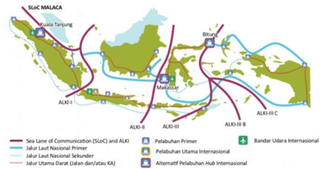
Gambar 1.1 Alur Laut Kepulauan Indonesia

sebagai perairan kepulauan, Indonesia bertanggung jawab untuk menyediakan jalur lalu lintas laut yang aman bagi kapal-kapal yang ingin bernavigasi atau bergerak melalui perairan Indonesia. Ini termasuk memberikan jaminan keamanan dan keselamatan bagi kapal-kapal tersebut saat mereka berlayar atau melewati perairan tersebut. Untuk itu, pemerintah Indonesia telah menentukan dan menetapkan jalur lalu lintas bagi kapal-kapal pengguna laut dalam dan luar negeri di perairan yurisdiksi nasional sebagai ALKI beserta segala risiko yang diakibatkannya (Sulistyaningtyas et al., 2015).