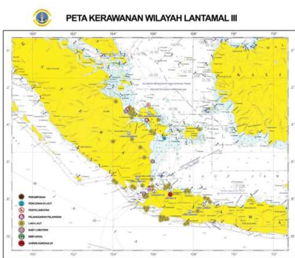
Gambar 1.5 Peta Kerawanan Lantamal III Jakarta 2024