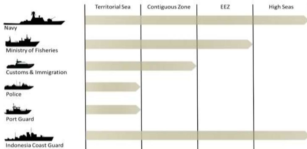
Gambar 1.4 Tata Kelola Pertahanan Laut

Berdasarkan UU No. 3 Tahun 2002 tentang Pertahanan Negara, Pasal 7 ayat 2 menyatakan bahwa sistem pertahanan negara dalam menghadapi ancaman militer menetapkan TNI sebagai komponen utama, didukung oleh komponen cadangan dan komponen pendukung. Sesuai dengan UU No. 34 Tahun 2004 tentang TNI, Pasal 7 ayat (1), tugas pokok TNI adalah mempertahankan kedaulatan negara, keutuhan wilayah NKRI berdasarkan Pancasila dan UUD 1945, serta melindungi bangsa dan seluruh tumpah darah Indonesia dari ancaman dan gangguan terhadap keutuhan bangsa dan negara. Tugas ini diwujudkan melalui Operasi Militer untuk Perang (OMP) dan Operasi Militer Selain Perang (OMSP). Beberapa kegiatan dalam OMSP meliputi mengatasi gerakan separatisme bersenjata, pemberontakan bersenjata, terorisme, mengamankan objek vital nasional yang strategis, membantu pemerintah dalam mengamankan pelayaran dan penerbangan dari pembajakan, perompakan, dan penyelundupan.