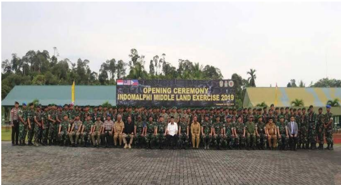
Gambar 4.3. Opening Ceremony Indomalphi Middle Land Exercise di Tarakan, Kalimantan Utara Tahun 2019