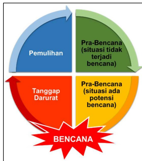
Bagan 2.1 Tahapan Manajemen Bencana

tahapan yang kaku. Oleh sebab itu, pada saat yang bersamaan, kegiatan dari tahap yang berbeda akan dilaksanakan berdasarkan porsi masing-masing. Ketiga tahapan atau siklus manajemen bencana dapat diilustrasikan pada Bagan 2.1.