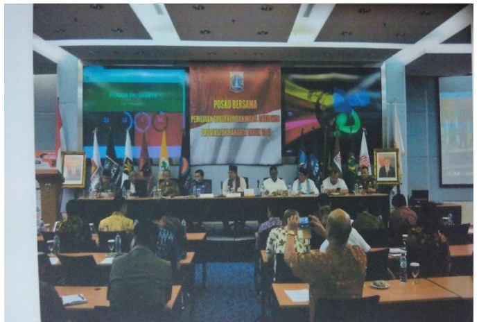
Koordinasi pos komando bersama pilgub 2017