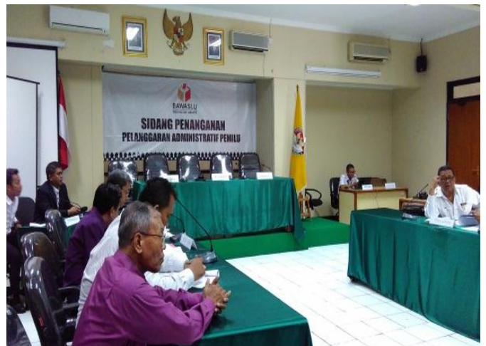
Contoh sidang pelanggaran Administrasi Pemilu, Kantor Bawaslu provinsi DKI Jakarta, 17 Oktober 2018