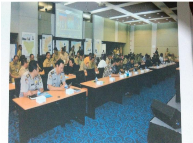
Koordinasi pos komando bersama pilgub 2017