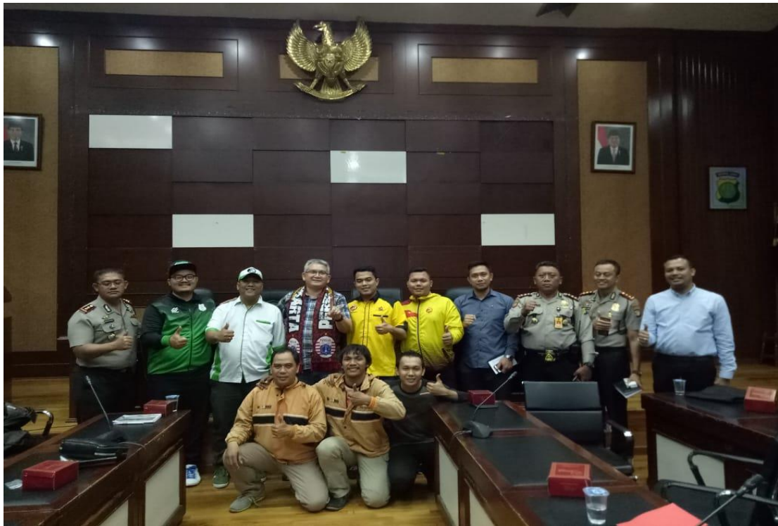
Gambar 4.5 Foto Pertemuan Perwakilan Polda Metro Jaya dengan Kelompok Suporter Menjelang Pertandingan