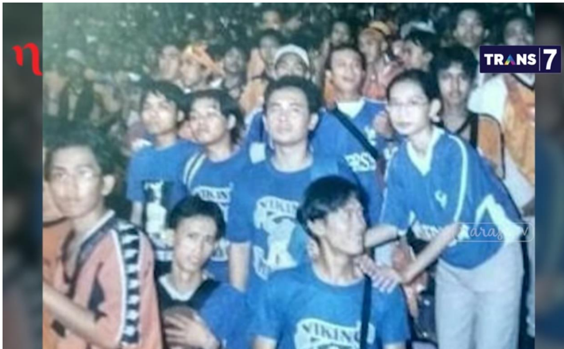
Gambar 4.2. Foto The Jakmania dan Viking di Stadion Lebak Bulus

sama. Sebuah pemandangan yang masih sulit untuk disaksikan hingga saat ini.