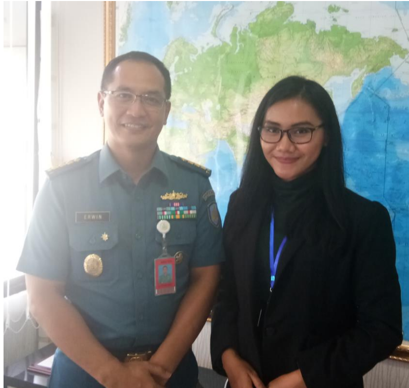
Wawancara: Staff Operasi TNI AL