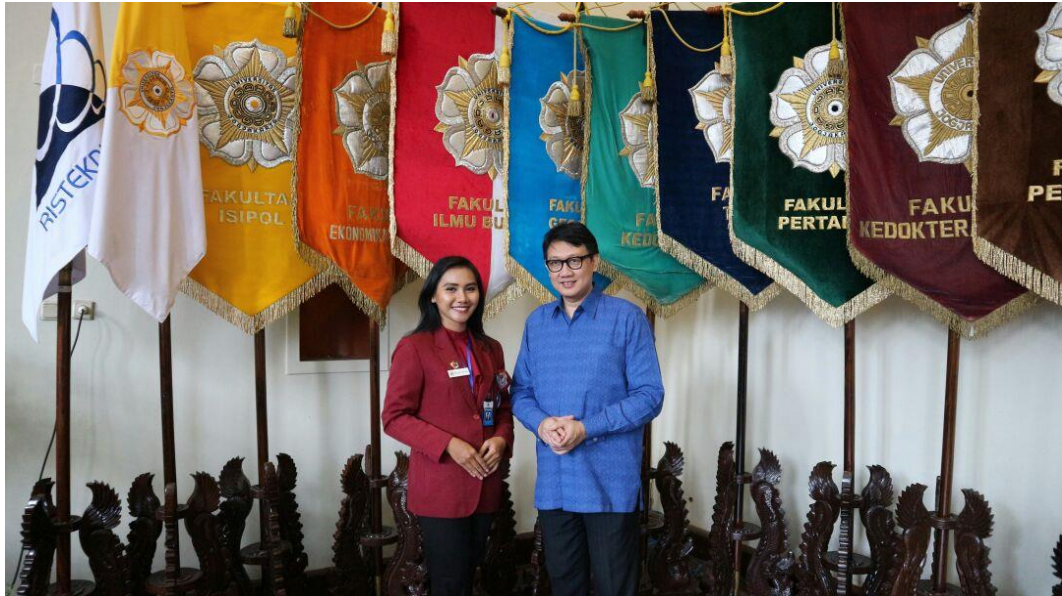
Wawancara: Kementerian Koordinator Bidang Kemaritiman