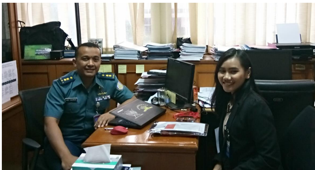
Wawancara: Staff Perencanaan TNI AL