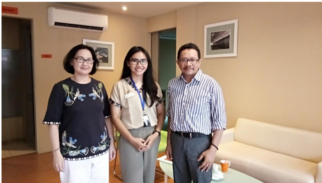
Wawancara: Lembaga Ilmu Pengetahuan Indonesia