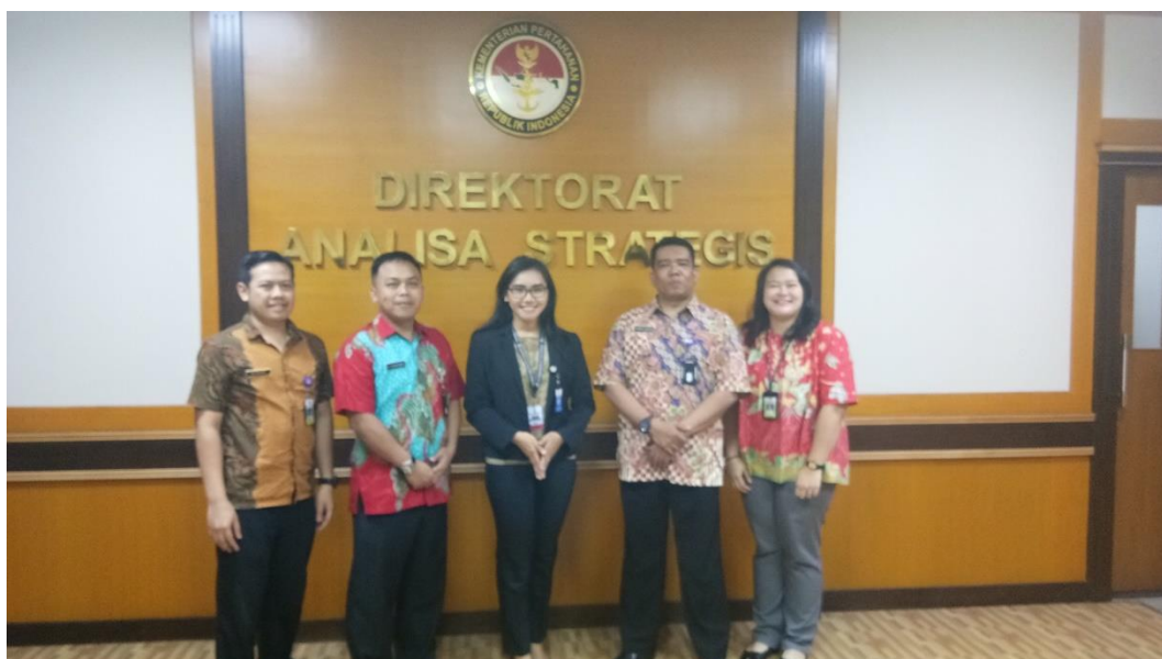
Wawancara: Kementerian Pertahanan RI