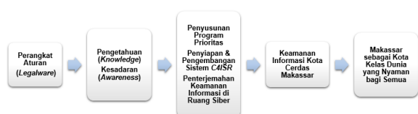
Gambar 2. Hubungan antar kategori

Analisis lebih lanjut terhadap keamanan informasi Kota Cerdas Makassar memberkan pemahaman hubungan antar kategori yang selanjutnya dijadikan dasar untuk menyusun suatu teori strategi keamanan informasi yang dapat dijadikan referensi untuk diaplikasikan dalam pengembangan Kota Cerdas Makassar. Hubungan antar kategori tersebut disajikan pada Gambar 2, sebagai berikut: