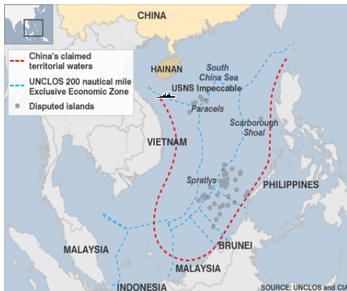
Gambar 1 Posisi Kapal USNS Impeccable Surveillance Ship di perairan dekat pulau Hainan.

Contoh kasus aktivitas militer yang disalahgunakan adalah kasus kapal USNS Impeccable Surveillance Ship yang melakukan kegiatan pengamatan/pengintaian di wilayah 75 mil laut dari pulau Hainan – Laut China Selatan (Gambar 1) 8 .