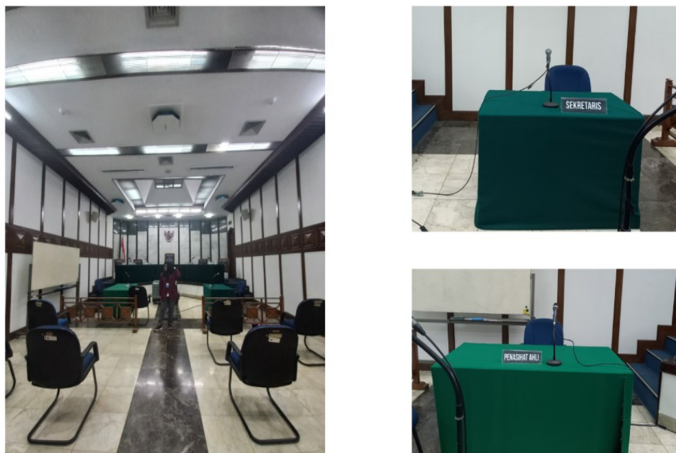
Gambar 4.3 Ruang Sidang Mahkamah Pelayaran