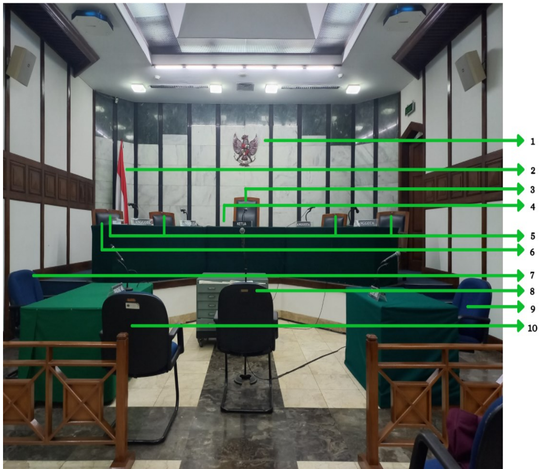
Gambar 4.2 Ruang Sidang Mahkamah Pelayaran