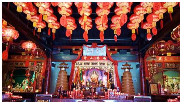
Gambar 4.9 Tiga Altar Utama Klenteng Hok Tek Bio

Klenteng Hok Tek Bio menjadi nama yang dikenal bagi masyarakat etnis Tionghoa. Sementara nama Vihara Dhanagun menjadi nama nasional bagi tempat ini. Berdasarkan observasi langsung ke lokasi dan penjelasan Bapak Ayung, tempat ini sebenarnya terbagi menjadi tiga bagian utama. Bagian tengah (utama) adalah altar utama untuk bersembahyang kepada tiga dewa dan dewi utama yang diletakkan di sana yaitu : Dewa Hok Tek Ceng Sin (Dewa Bumi, pembawa rezeki bagi pedagang dan masyarakat pada umumnya) sebagai dewa utama (tuan rumah) , Dewa Kwan Kong (Panglima perang dan dewa pelindung perdagangan) dan Dewi Kwan Im (Dewi welas asih). Keberadaan dan penempatan dewa-dewi ini disesuaikan dengan karakteristik wilayah tempat klenteng tersebut berada. Banyaknya lilin dan hio yang dinyalakan serta kertas doa yang dibakar menandai bahwa klenteng ini ramai dengan kegiatan spiritual.