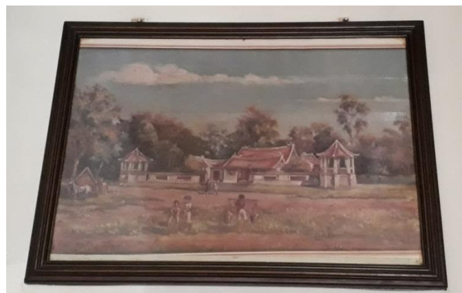
Gambar 4.7 Klenteng Hok Tek Bio pada masa lampau