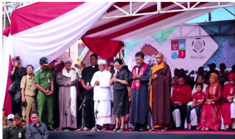
Gambar 4. 17 Doa Lintas Agama di Panggung CGM

Masyarakat Kota Bogor yang beranekaragam entitas identitasnya hidup dalam sebuah keharmonisan. Nilai-nilai budaya damai yang lahir dan berkembang dalam masyarakat Kota Bogor tumbuh subur berkat peran para tokoh agama dan masyarakat yang bersinergi juga dengan pemerintah. Para tokoh agama dan masyarakat membangun komunikasi dan dialog lewat forum bersama. Setidaknya ada dua organisasi yang berperan penting dalam pembinaan kerukunan umat beragama di Kota Bogor yaitu FKUB dan BASOLIA.