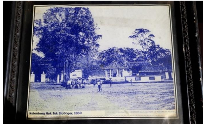
Gambar 4.14 Foto Klenteng Hok Tek Bio Bogor pada tahun 1860