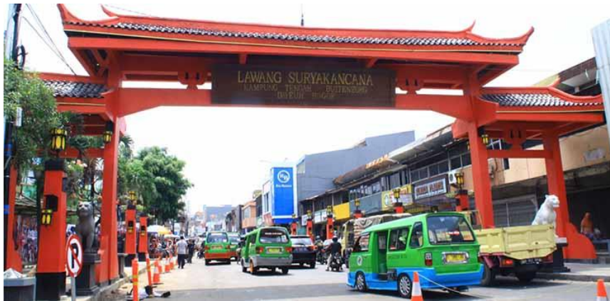
Gambar 4.6 Gerbang Lawang Suryakencana