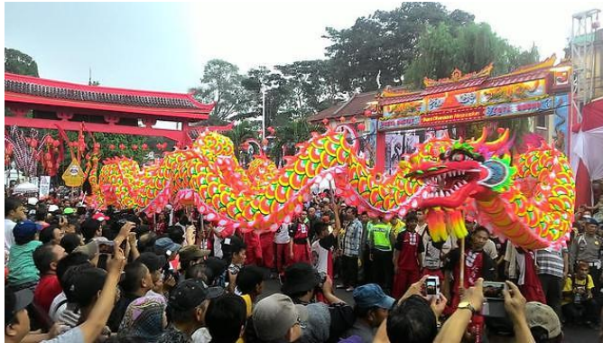
Gambar 4.3 Seni Liong Sebagai Simbol Keberkahan dan Penolak Bala