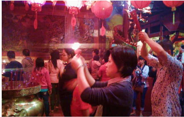
Gambar 4.1 Suasana Doa Malam Cap Go Meh di Vihara Dhanagun

Sumber : Muhammad Syadri, Jayapos (2017)