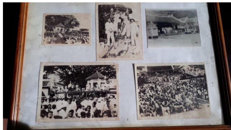
Gambar 4.15 Cap Go Meh di Bogor Pada Masa Hindia Belanda

Gambaran awal perayaan Cap Go Meh terekam dalam jejak dokumentasi yang dipajang pada salah satu dinding Klenteng seperti yang digambarkan di bawah ini.