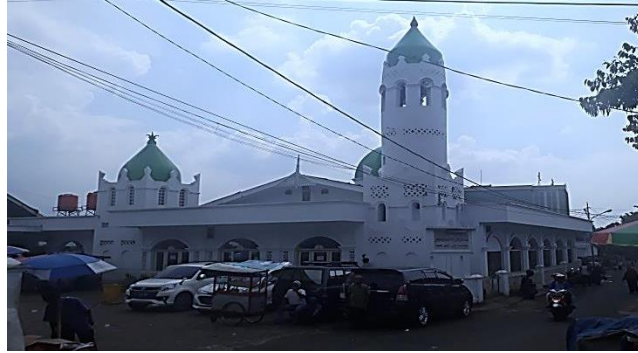
Gambar 4.12 Masjid An –Nur, Masjid Keramat Empang