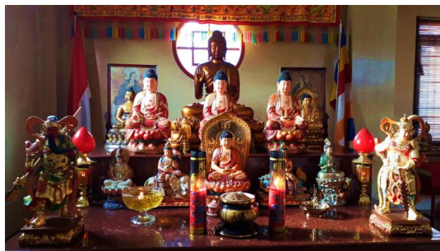
Gambar 4.10 Altar Boddhisatva Kshitigarbha di Vihara Dhanagun