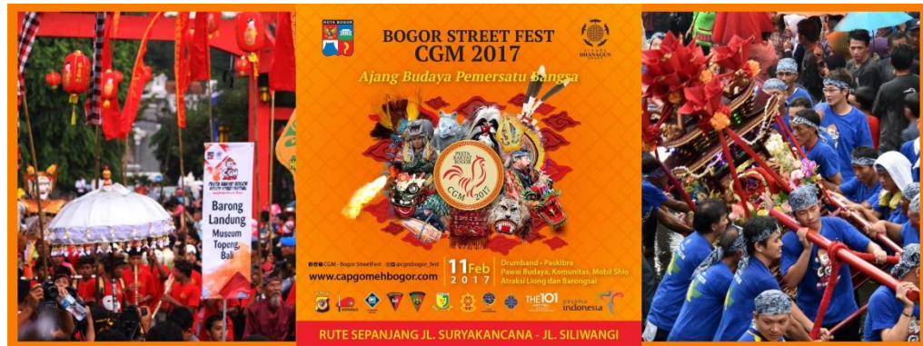
Gambar 4.4 Poster Bogor Street Festival CGM 2017

perayaan Cap Go Meh dikemas dalam konsep pesta budaya nusantara dengan menampilkan berbagai budaya nusantara dalam kirab/festival.