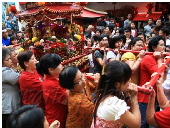
Gambar 4.2 Perarakan Tapekong dari Vihara Dhanagun

Perayaan kedua adalah festival atau kirab. Dalam perayaan ini diadakan perarakan rupang atau tapekong (patung dewa-dewi) yang ditahtakan di dalam joli-joli. Joli-joli ini diarak keluar dari tempat upacara untuk berkeliling di jalur perarakan yang sudah direncanakan. Perarakan ini dipercayai sebagai pembawa berkat. Tarian barongsai dan liong sebagai lambang kemakmuran dan penolak bala turut melengkapi dan memeriahkan perayaan kirab ini.