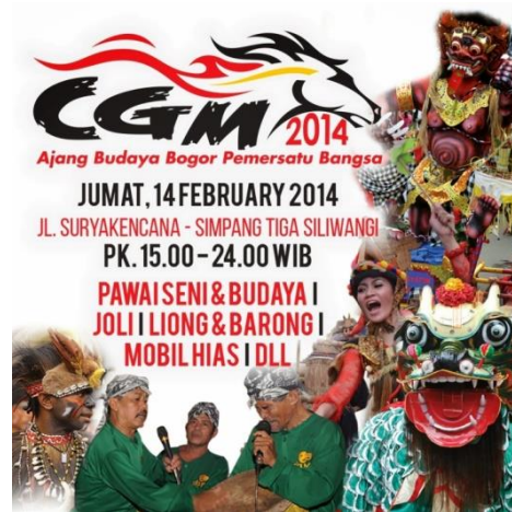
Gambar 4.16 Poster CGM 2014