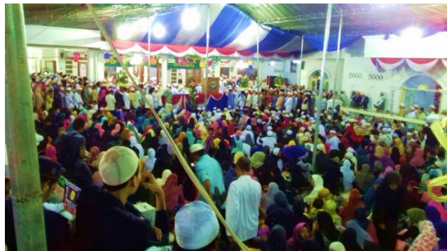
Gambar 4.13 Suasana Doa di Masjid Keramat Empang saat Maulid Nabi