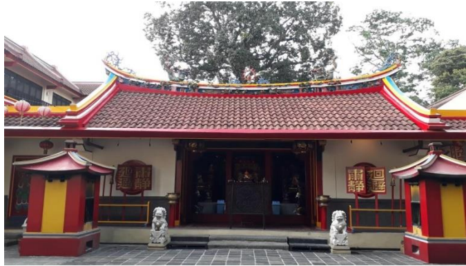
Gambar 4.8 Klenteng Hok Tek Bio pada masa kini