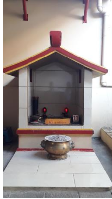
Gambar 4.11 Altar Doa bagi Mbah Bogor di Vihara Dhanagun