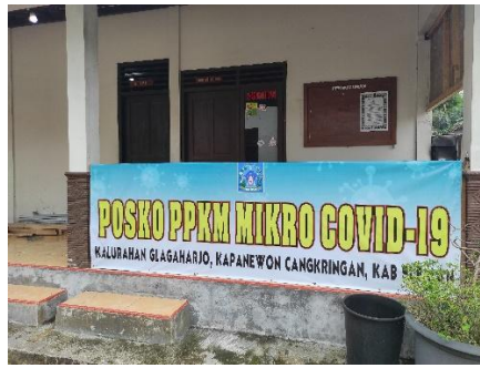
Posko PPKM Mikro Covid-19