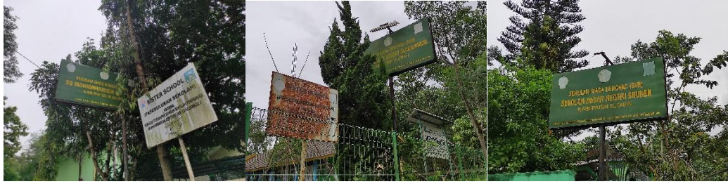
SD dengan Program Sekolah Siaga Bencana (SSB) dan Sister School