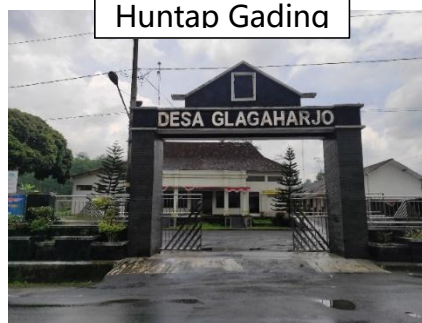
Balai Desa Glagahario