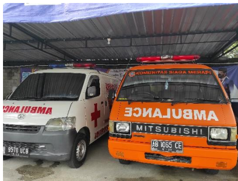
Sarpras Ambulan KSM