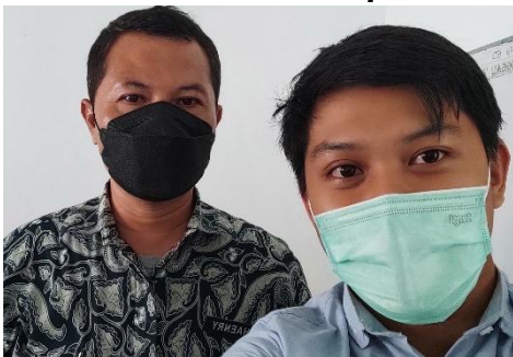
Wawancara Kepala BPBD Sleman