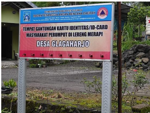
Tempat nametaq baqi perumput