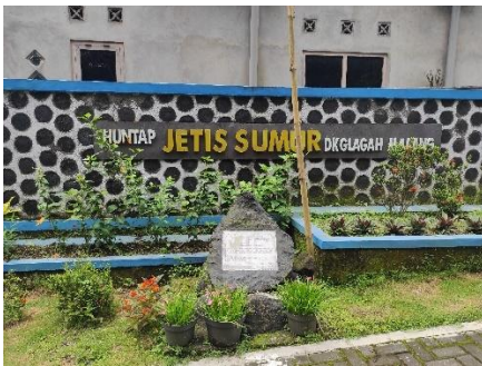
Huntap Jetis Sumur