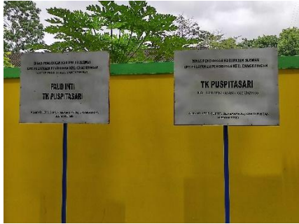
TK dan Paud di Desa Glaahario