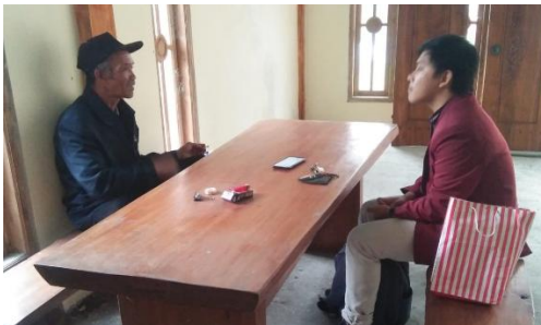
Wawancara Kepala Dusun Kalitengah Lor