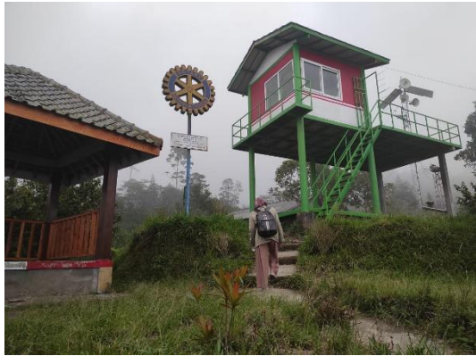
Pos Pemantauan di Bukit Klanqon