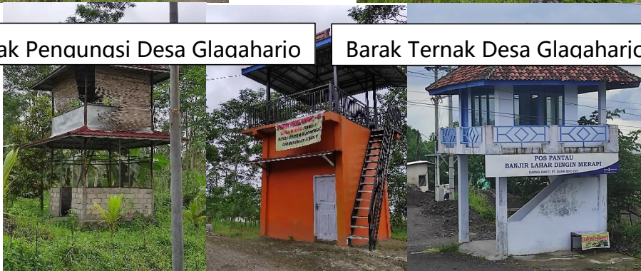
Pos Pemantauan Gunung Merapi