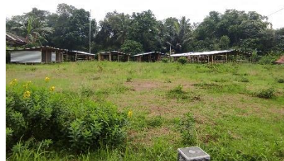
Barak Ternak Desa Glaahario