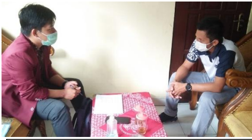
Wawancara Carik Desa Glagahario