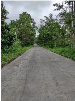
Jalan Poros Desa