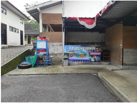
Pos Jaga Relawan KSM