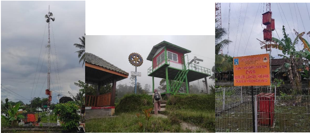
Sarana Prasarana Early Warning System (EWS) Desa Glagaharjo