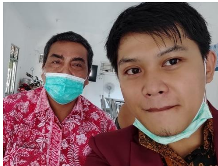
Wawancara Kecamatan Cangkringan