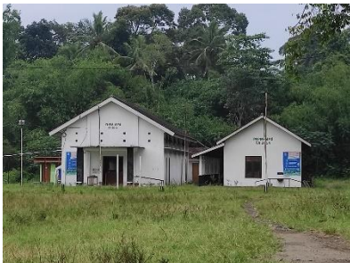
Barak Penunasi Desa Glaahario