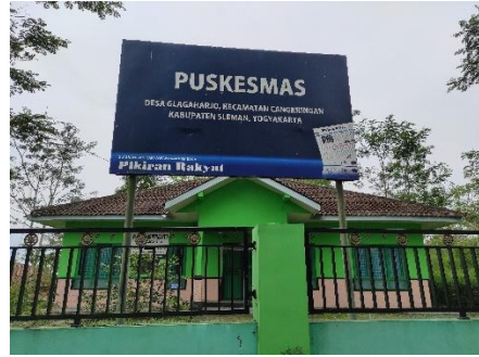
Puskesmas di Desa Glaahario