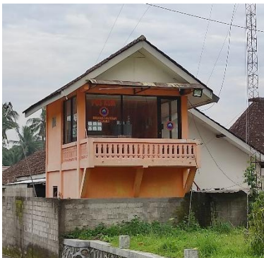
Posko Pemantauan Utama Relawan KSM