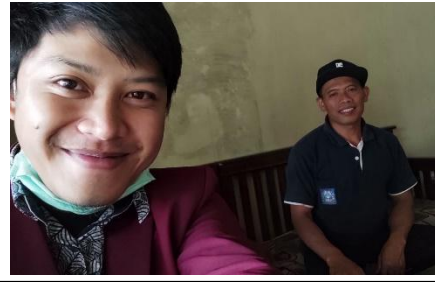
Wawancara Kepala Dusun Srunen