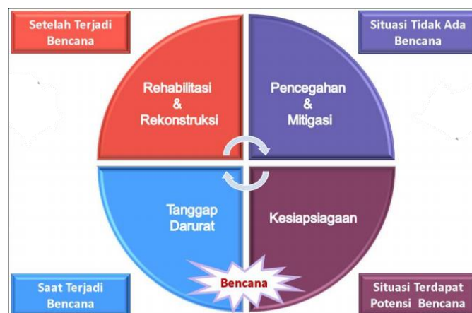
Gambar 2. 1 Tahapan Penanggulangan Bencana

Manajemen bencana modern dibagi berdasarkan empat tahapan, yaitu mitigasi, kesiapsiagaan, tanggap darurat, dan pemulihan-rekonstruksi. Dalam pelaksanaannya, empat tahapan manajemen bencana dibagi dalam beberapa tingkatan yaitu pra bencana, saat bencana, dan pasca bencana. Manajemen bencana dikenal dengan empat tahapan penanggulangan sebagaimana yang tercantum pada gambar di bawah ini.