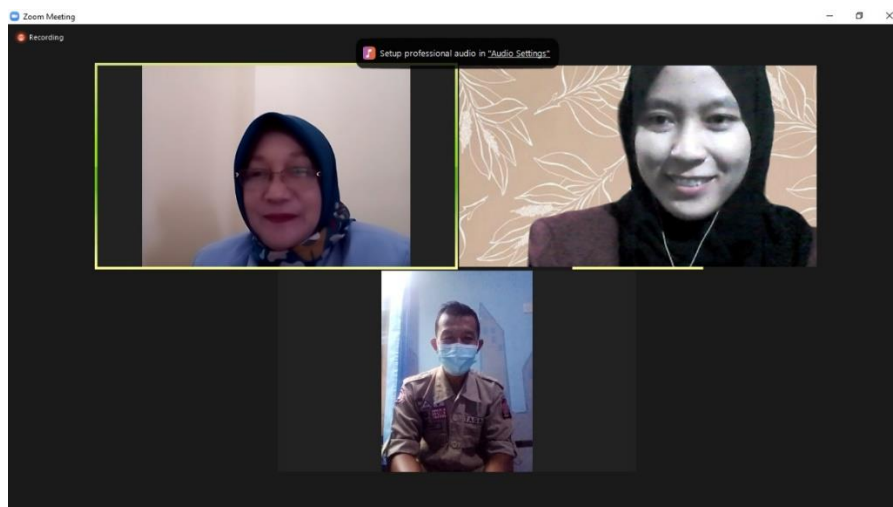
Gambar Lampiran 3. Wawancara dengan Kepala Seksi Bantuan Fakir Miskin dan Korban Bencana dan Wakil Koordinatort Tagana, Dinas Sosial, Kabupaten Bantul