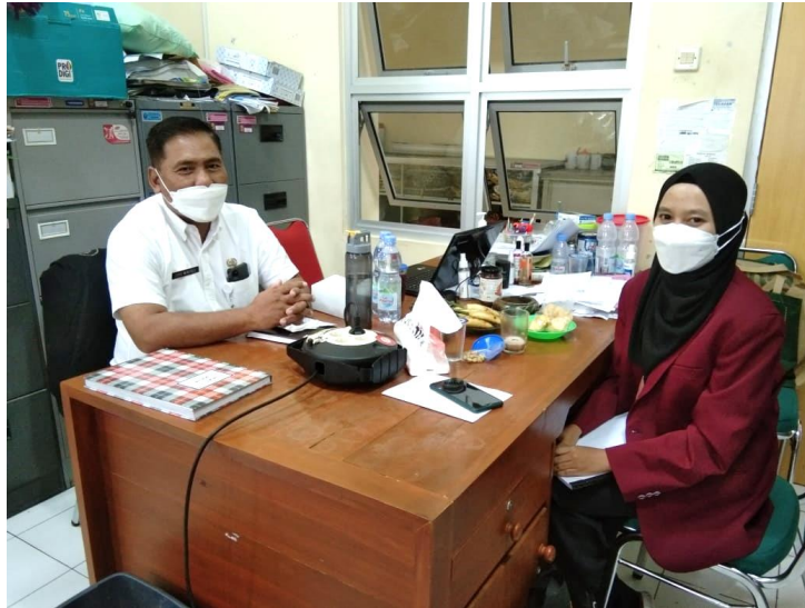
Gambar Lampiran 5. Wawancara dengan Kepala Seksi Objek Daya Tarik Wisata, Dinas Pariwisata, Kabupaten Bantul