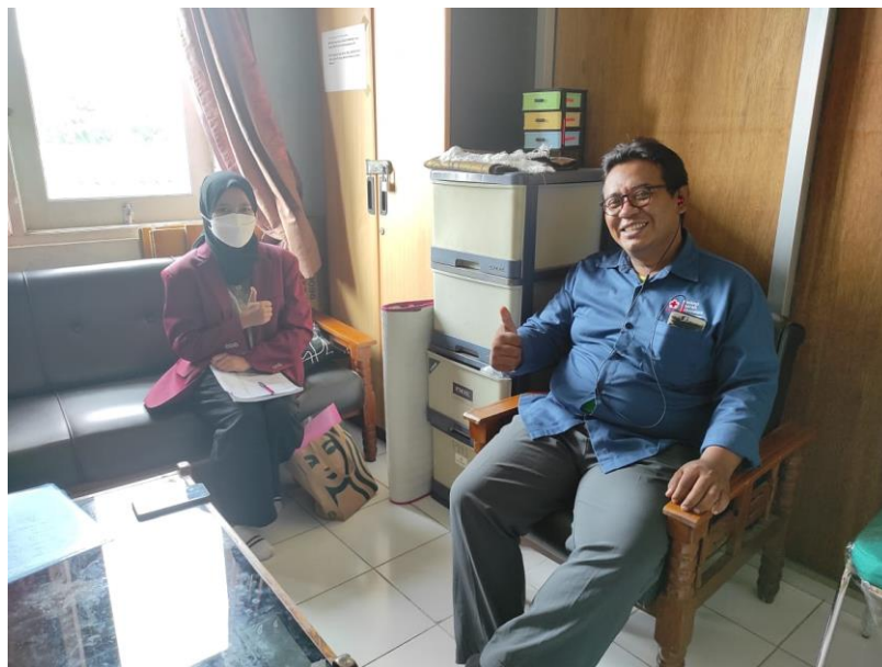
Gambar Lampiran 7. Wawancara dengan Staf Bidang Penanggulangan Bencana, PMI, Kabupaten Bantul