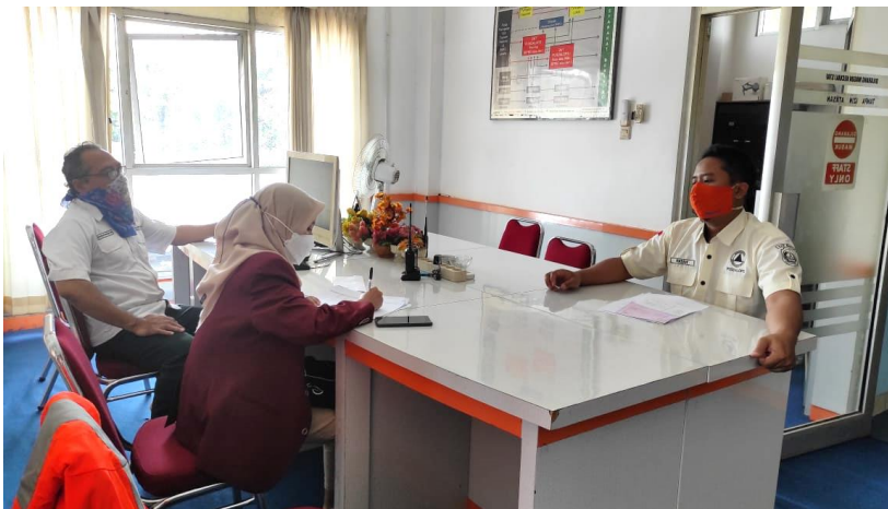
Gambar Lampiran 1. Wawancara dengan Kepala Seksi Kesiapsiagaan dan Staf Pusdalops, BPBD, Kabupaten Bantul