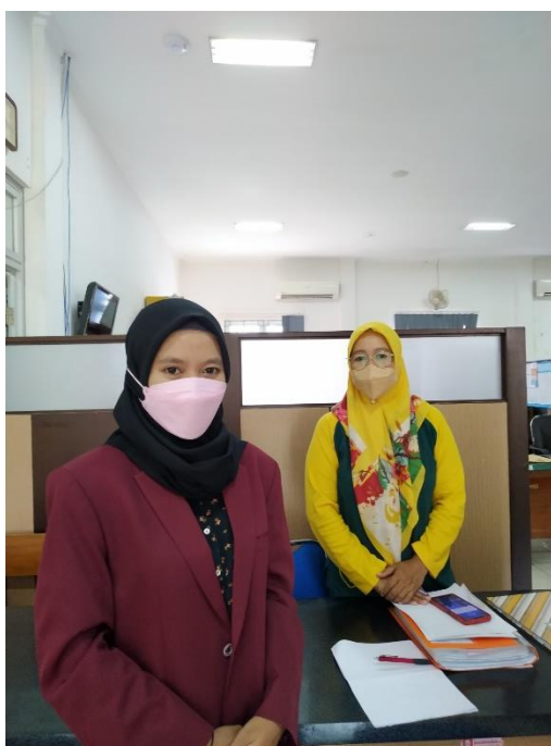
Gambar Lampiran 4. Wawancara dengan Staf Pelayanan Kesehatan, Dinas Kesehatan, Kabupaten Bantul