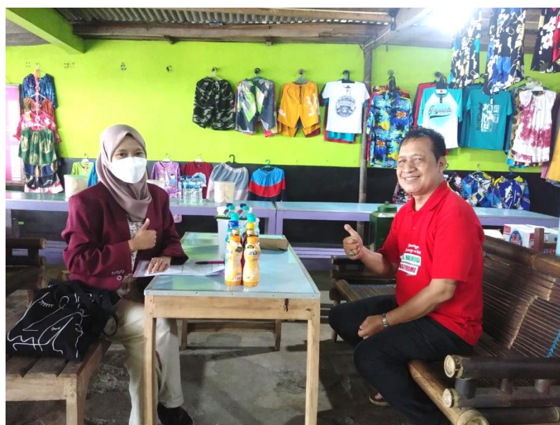
Gambar Lampiran 12. Wawancara dengan Ketua RT 05, Kelurahan Parangtritis, Kabupaten Bantul