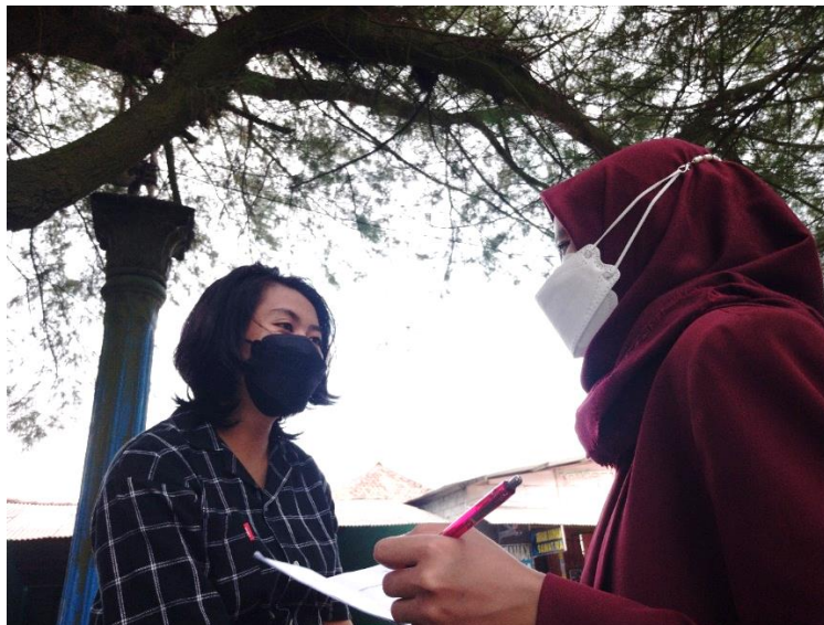
Gambar Lampiran 15. Wawancara dengan Wisatawan di Pantai Parangtritis