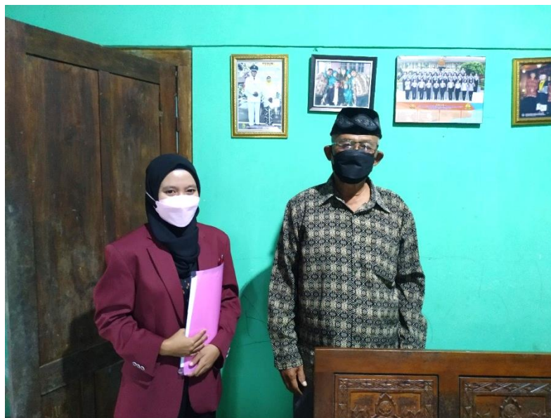
Gambar Lampiran 9. Wawancara dengan Lurah Parangtritis, Kabupaten Bantul