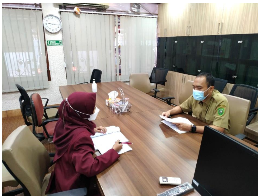
Gambar Lampiran 2. Wawancara dengan PLT Kepala Sub Bidang Ketahanan Pangan dan Pengelolaan Sumber Daya Alam, Bappeda, Kabupaten Bantul