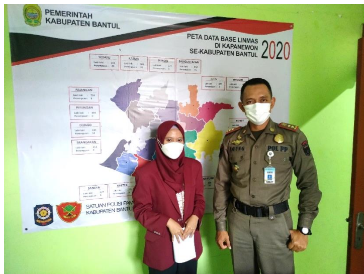
Gambar Lampiran 6. Wawancara dengan Kepala Bidang Perlindungan Masyarakat, Satpol PP, Kabupaten Bantul