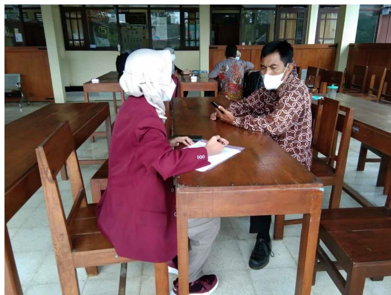
Gambar Lampiran 10. Wawancara dengan Kamituwo Kelurahan Parangtritis, Kabupaten Bantul