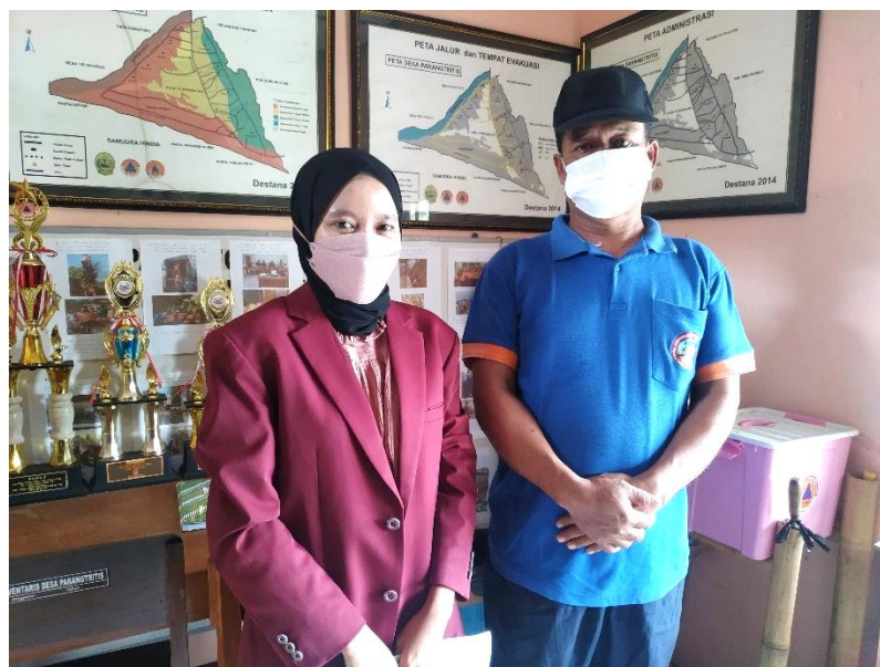
Gambar Lampiran 11. Wawancara dengan Ketua FPRB Paris Tangguh