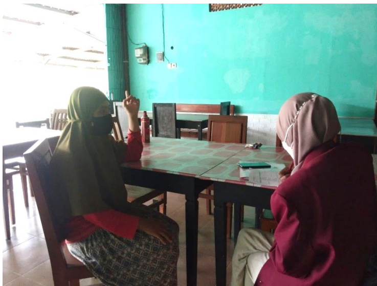
Gambar Lampiran 13. Wawancara dengan Ketua RT 06, Kelurahan Parangtritis, Kabupaten Bantul