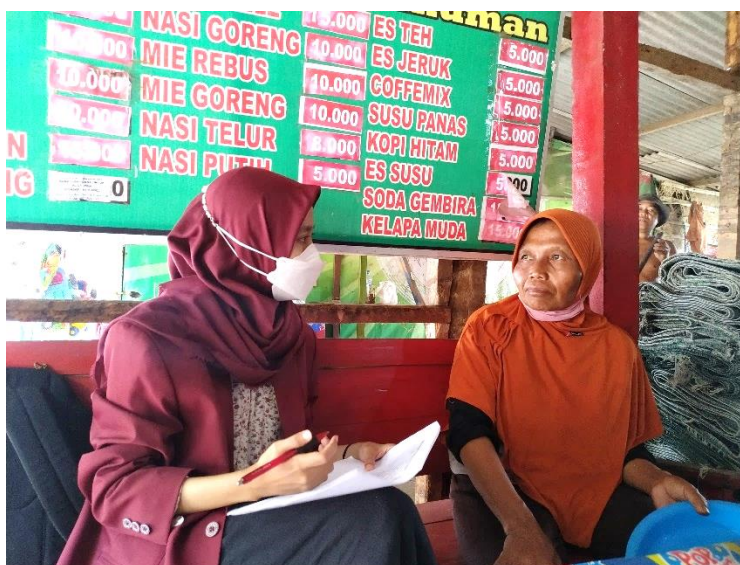
Gambar Lampiran 14. Wawancara dengan Pedagang di Kawasan Objek Wisata Pantai Parangtritis