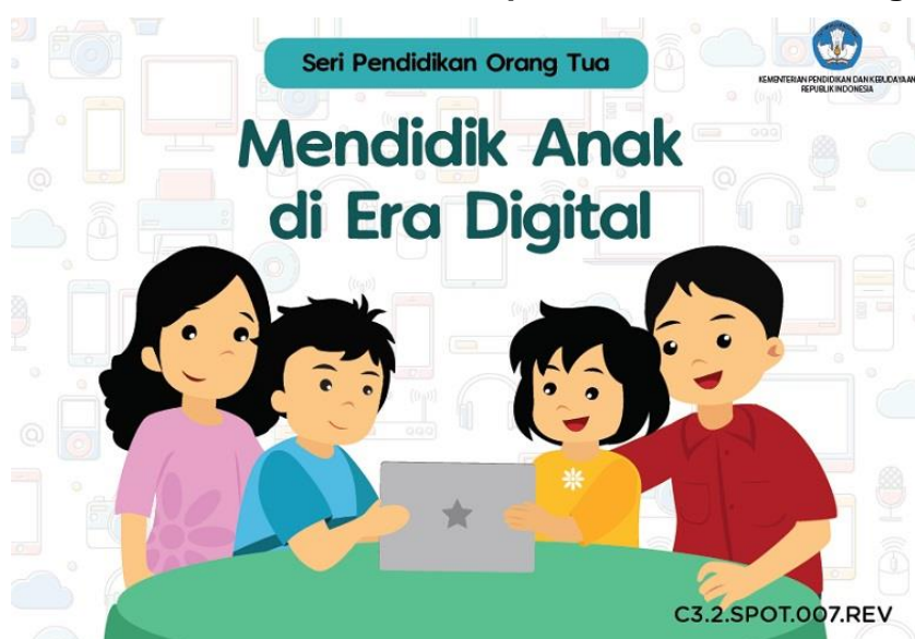
Gambar 4.2 Contoh e-book panduan literasi keluarga

Berdasarkan observasi terhadap laman Gerakan Literasi Nasional ( https://gln.kemdikbud.go.id/glnsite/ ), di bagian Literasi Digital terdapat 15 entri sejak tahun 2017, terdiri dari 3 laporan kegiatan, 2 berita, dan 10 buku/infografik mengenai literasi digital. Dari 15 (lima belas) entri tersebut, terdapat 4 (empat) yang berkaitan dengan ranah keluarga yaitu laporan kegiatan forum Semiloka Kartini di Era Digital di Jakarta (25 April 2018); Majalah Pendidikan Keluarga yang sedang membahas khusus literasi digital (dalam bentuk e-book); Panduan Internet untuk Orang Tua (e-book), dan Mendidik Anak di Era Digital (e-book). E-book “Mendidik Anak di Era Digital” seperti terlihat di gambar 4.2 secara khusus merupakan contoh e-book yang baik dan mudah dimengerti sebagai panduan orang tua dalam mendidik putra putrinya di era informasi.