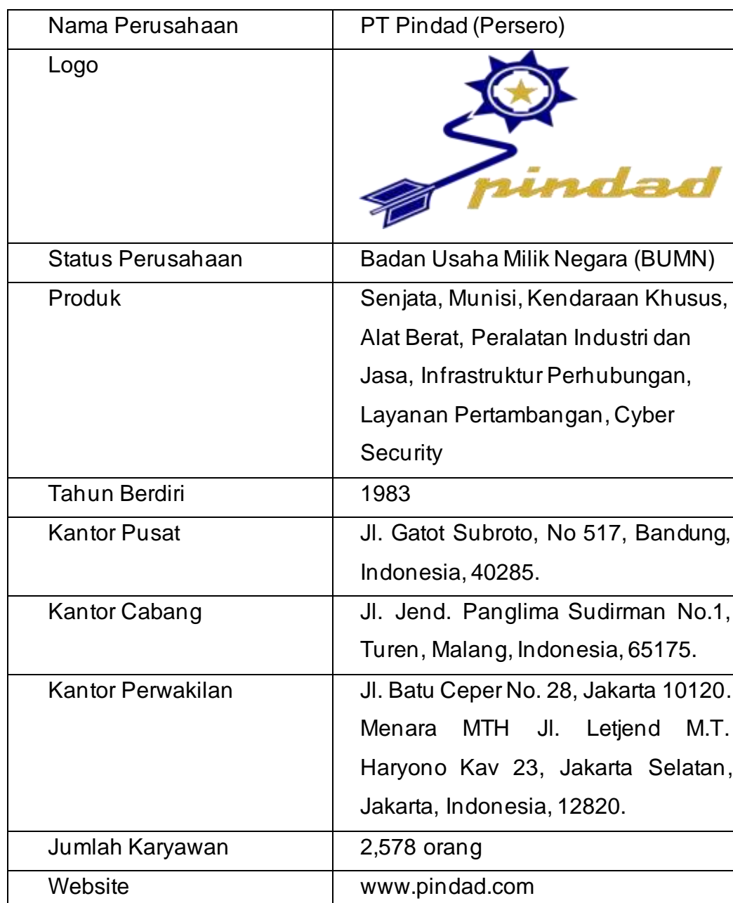
Tabel 4.1 Profil PT Pindad (Persero)

& keamanan negara” dengan jumlah karyawan mencapai 2,578 orang. Pada Tabel 4.1 berikut dijabarkan secara singkat profil PT Pindad (Persero).