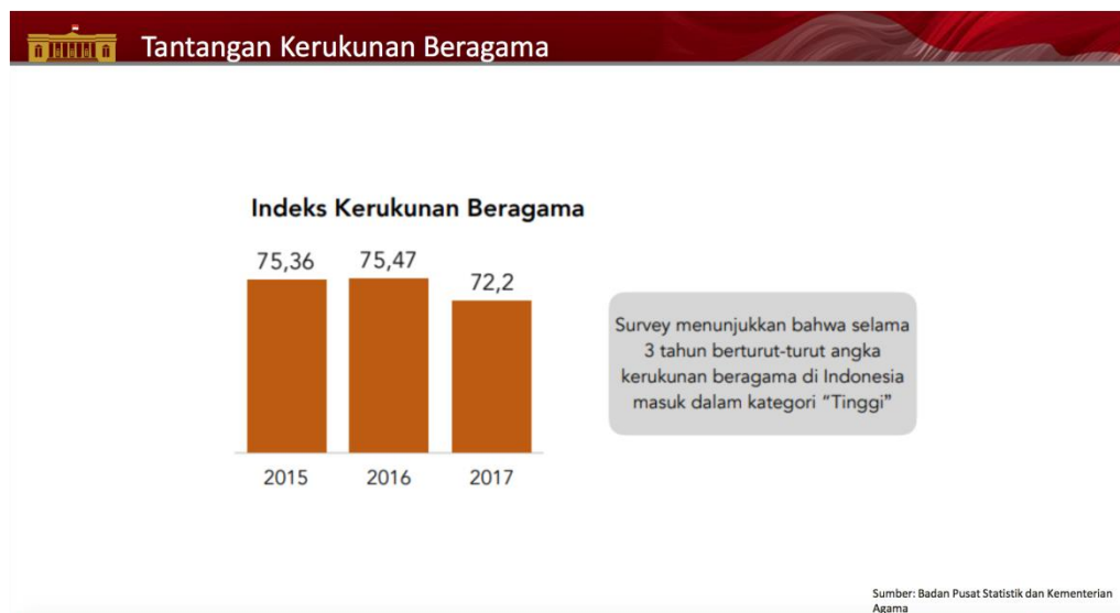
Gambar 1.3 Indeks Kerukunan Beragama

yaitu berkenaan dengan kelakuan, cara kehidupan dan sebagainya. Melalui pandangan stereotip ini, kanak-kanak belajar menghakimi seseorang atau sesuatu ide. Sikap prejudis atau prasangka juga dipelajari melalui proses yang sama.