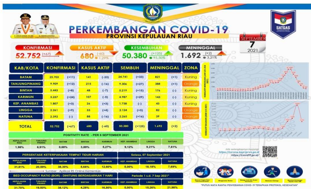
Gambar 1.1. Perkembangan Covid-19 di wilayah Prov. Kepri

Berikut data Perkembangan Corona virus di wilayah Prov. Kepulauan Riau pada tanggal 7 September 2021.