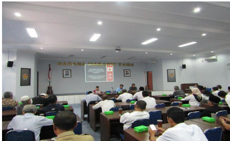
Gambar 1.2 Workshop Forum Kerukunan Umat Beragama DIY