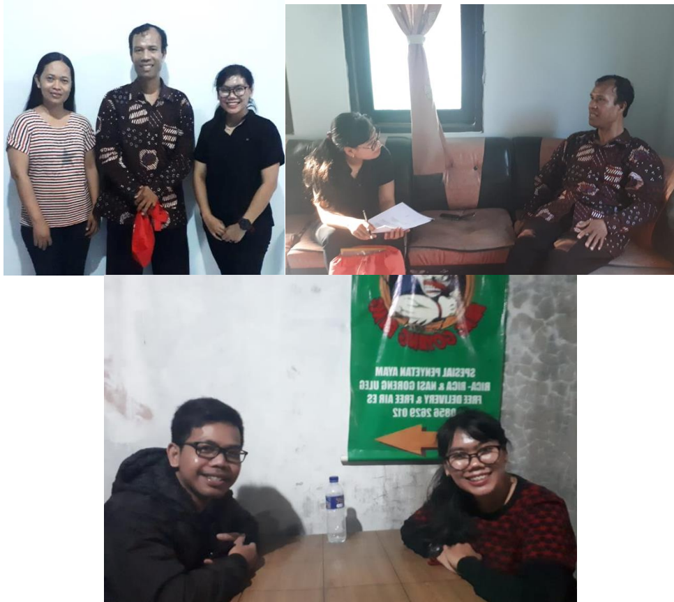
Gambar 1.9 Foto bersama dengan Narasumber dari Korban konflik yang bernuansa Agama