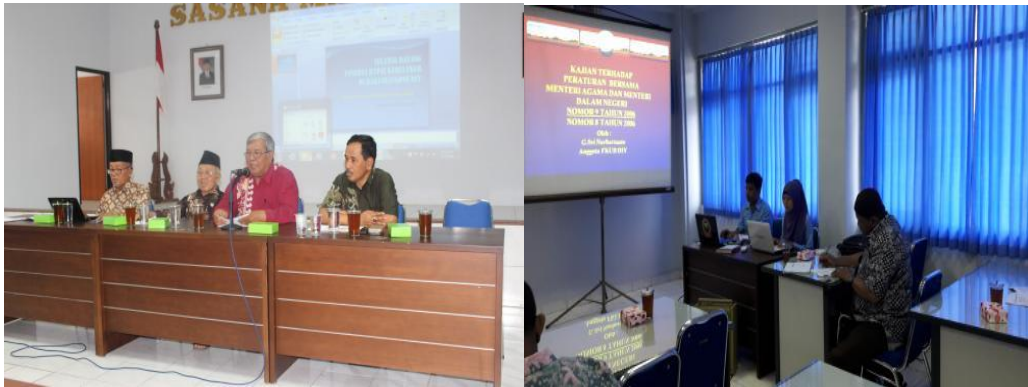
Gambar 1.1 Rapat Kerja Forum Kerukunan Umat Beragama