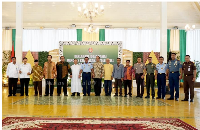
Gambar 1.7 Deklarasi Jogja Damai sebagai upaya mencegah terjadinya kembali kekerasan, intoleransi dan radikalisme