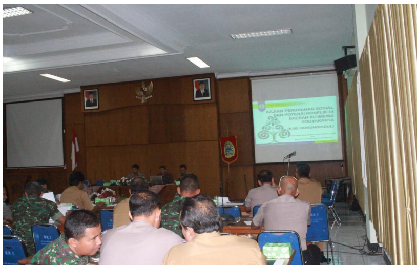
Gambar 1.5 FGD penyusunan rencana aksi penanganan perubahan sosial dan potensi konflik