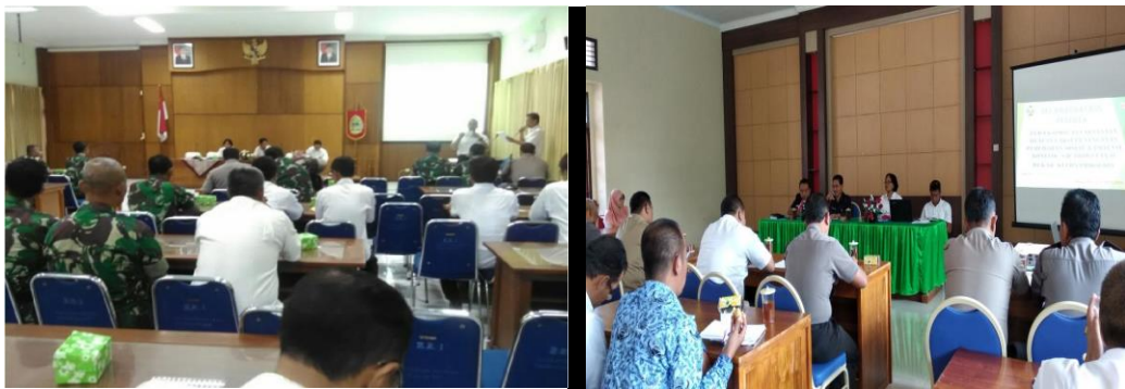
Gambar 1.4 FGD Kormonev penanganan perubahan sosial dan potensi konflik di DIY