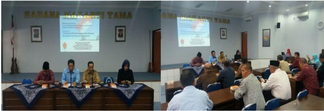
Gambar 1.6 Rapat Kerja Forum Kewaspadaan Dini Masyarakat