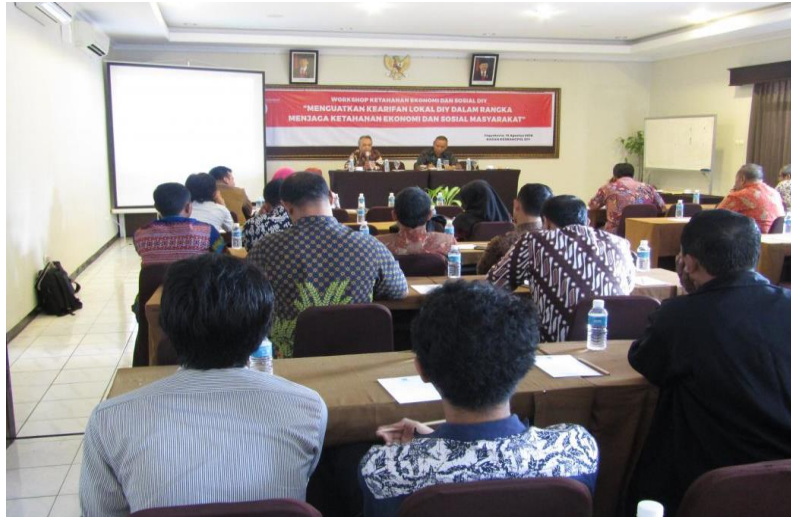
Gambar 1.3 Workshop ketahanan ekonomi dan sosial DIY