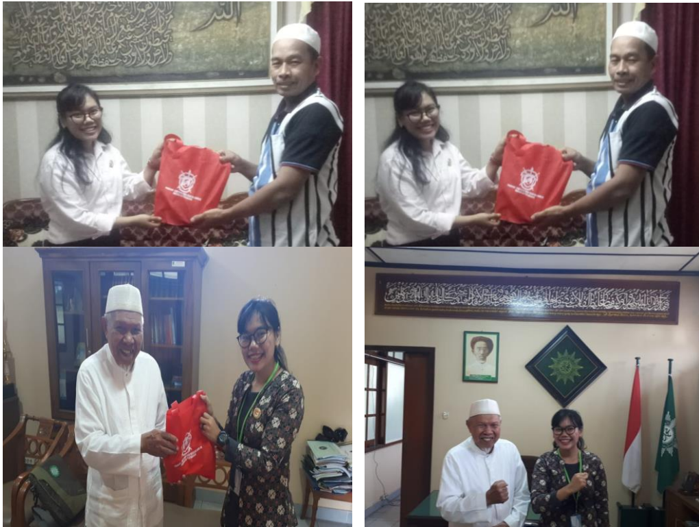
Gambar 1.8 Foto bersama dengan Narasumber dari Forum Kerukunan Umat Beragama