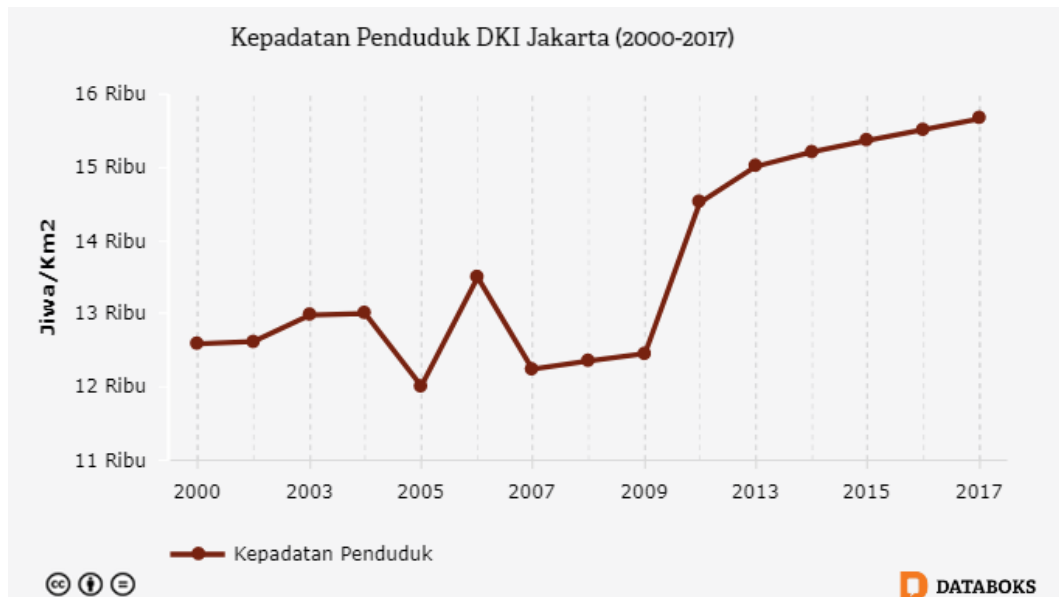
Gambar 9. Kepadatan Penduduk DKI Jakarta

Kepadatan penduduk ini kemudian menyebabkan berbagai permasalahan lainnya yang mengancam stabilitas keamanan di dalam masyarakat. Bidang sosial menjadi salah satu bagian yang juga terdampak secara langsung maupun tidak langsung dengan adanya kepadatan penduduk ini. Kondisi ini juga menyebabkan munculnya rumah kumuh, kekurangan air bersih, pengangguran, kemacetan, serta tingkat kriminalitas yang meningkat. Selain migrasi penduduk yang berjangka panjang, DKI Jakarta sebagai pusat pergerakan menjadi sasaran migrasi sementara yang diakibatkan para komuter maupun pendatang harian dari kota – kota sekitar. Migrasi sementara ini pada dasarnya diakibatkan kurangnya lahan hunian yang dapat dijangkau masyarakat dan pencaharian pekerjaan di Jakarta.