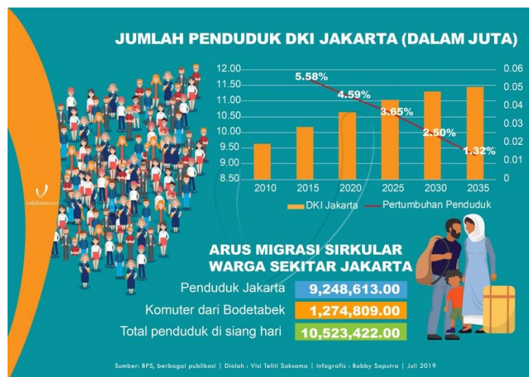
Gambar 10. Arus Migrasi Sirkular Jakarta

Berdasarkan Bappeda, penduduk miskin di DKI Jakarta bertambah 118,6 ribu orang menjadi 480,86 ribu orang pada Maret 2020. Jumlah tersebut setara dengan 4,53% dari total penduduk di ibukota dan naik 1,11% dibandingkan kondisi September 2019. Angka kemiskinan tersebut merupakan yang tertinggi dalam satu dekade terakhir dan hampir menyamai kondisi Jakarta 20 tahun lalu (4,96%). Sedangkan, berdasarkan data yang dikeluarkan Kementerian Dalam Negeri (2010), konflik sosial yang terjadi di Indonesia pada tahun 2010 berjumlah 93 kasus. Meskipun sempat menurun pada 2011 menjadi 77 kasus, namun jumlah konflik sosial kembali meningkat menjadi 89 kasus hingga akhir Agustus 2012. Tercatat dari Januari - November 2012 telah terjadi 104 peristiwa konflik dengan 8 pemicu utama konflik yaitu: bentrokan antar warga 33,6%, isu keamanan 25%, konflik Ormas 12,5%, sengketa lahan 12,5%, isu SARA 9,6%, eksekusi konflik politik 2,9%, konflik pada institusi pendidikan 2,8% dan kesenjangan sosial 0,9%.