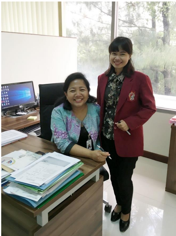
Wawancara Kasubdit Kerjasama Asia Tenggara, Kementerian Luar Negeri, 31 Oktober 2017, Pukul. 15.00 – 16.30 Wib