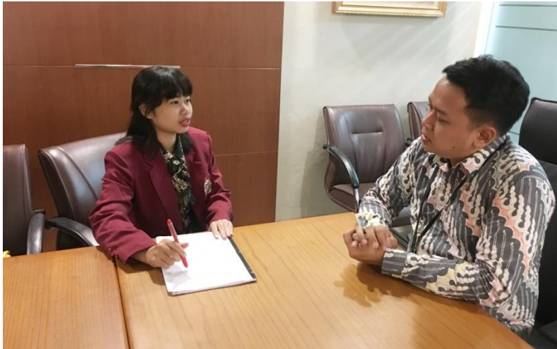
Wawancara staff Kasubit Hukum dan Perjanjian Internasional, Kementerian Luar Negeri, 1 November 2017, Pukul. 14.30 – 15.30 Wib