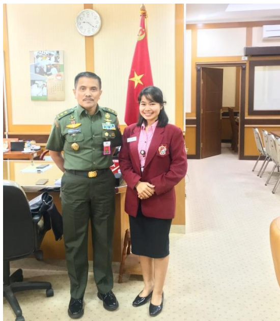
Wawancara Direktur Jenderal Strategi Pertahanan, Kementrian Pertahanan, 19 Oktober 2017, Pukul. 07.30 – 09.30 Wib