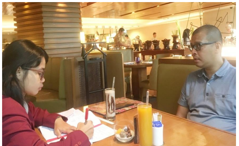
Wawancara Akademisi Pertahanan, Andi Widjayanto, 27 Oktober 2017, Pukul. 11.30- 12.30 Wib