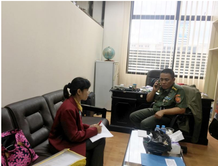
Wawancara Kasubdit Bilateral, Kerjasama Internasional, Kementrian Pertahanan, 17 Oktober 2017 Pukul. 14.00-15.30 Wib