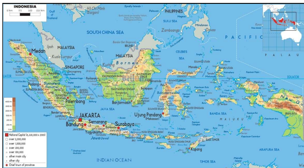
Gambar 1.1 Peta Indonesia HD : Gambar, Batas dan Luas

garis pantai ± 81.000 km, dimana terdapat 17.504 pulau yang dimiliki, terdiri atas 5.698 pulau bernama dan 11.806 pulau yang tidak atau belum bernama. Wilayah NKRI yang sangat luas memiliki implikasi pertahanan negara yang kompleks dan sangat terbuka dan mudah dimasuki oleh siapa saja dari berbagai penjuru dan arah. Negara Kesatuan Republik Indonesia (NKRI) terletak pada posisi persilangan diantara dua benua dan dua samudra serta berbagai jalur lalu lintas dunia dengan letak konfigurasi yang ada dari tujuh belas ribu pulau-pulau dan panjang garis pantai mencapai kurang lebih 81.000 km 2 , serta luas laut 5,9 juta km 2 dengan perincian luas kepulauan yaitu 2,8 juta km 2 , luas laut teritorial 0,4 juta km 2 , luas wilayah Zona Ekonomi Eksklusif (ZEE) 2,7 juta km 2 serta klaim terhadap batas wilayah landas kontinen 0,8 juta km 2 , dengan jumlah pulau-pulau besar dan pulau-pulau kecil sekitar 17.506 pulau (Darto, 2016).