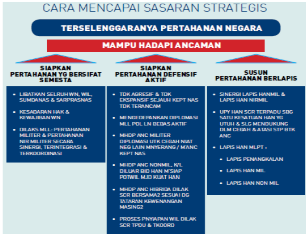
Gambar 2.3 Cara Mencapai Sasaran Strategis

kuat dan berdaya tinggi (Buku Putih Pertahanan Indonesia, 2015).