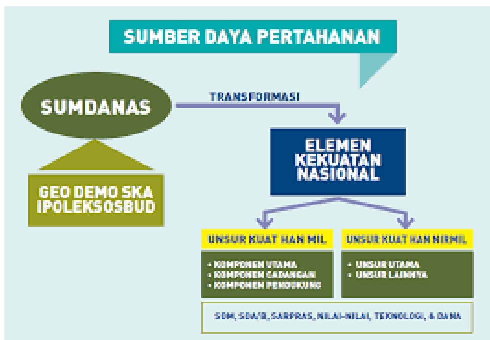
Gambar 2.2 Sumber Daya Pertahanan