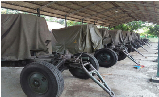
Gambar 2. Meriam 57 MM S-60/T.AKT

Penggunaan kekuatan pada hakikatnya merupakan elemen dari strategi militer. Strategi militer merupakan seni dan ilmu untuk membagi dan mengaplikasikan semua kekuatan militer untuk mencapai tujuan sebuah negara. Strategi ini memberikan arah untuk menggunakan kekerasan atau cara-cara persuasif dalam mencapai sasarannya