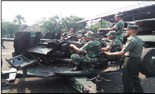
Gambar 3. Penggunaan Meriam 57 MM S-60/T.AKT

tugas dalam rangka pertahanan udara atau untuk mengantisipasi adanya kemungkinan serangan udara. Penggunaan alutsista dilaksanakan atas perintah Komando Atas.