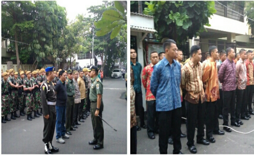
Gambar 4. Kegiatan Pengamanan VVIP Presiden RI-1

adanya kegiatan VVIP baik Presiden, Wapres maupun Tamu negara.