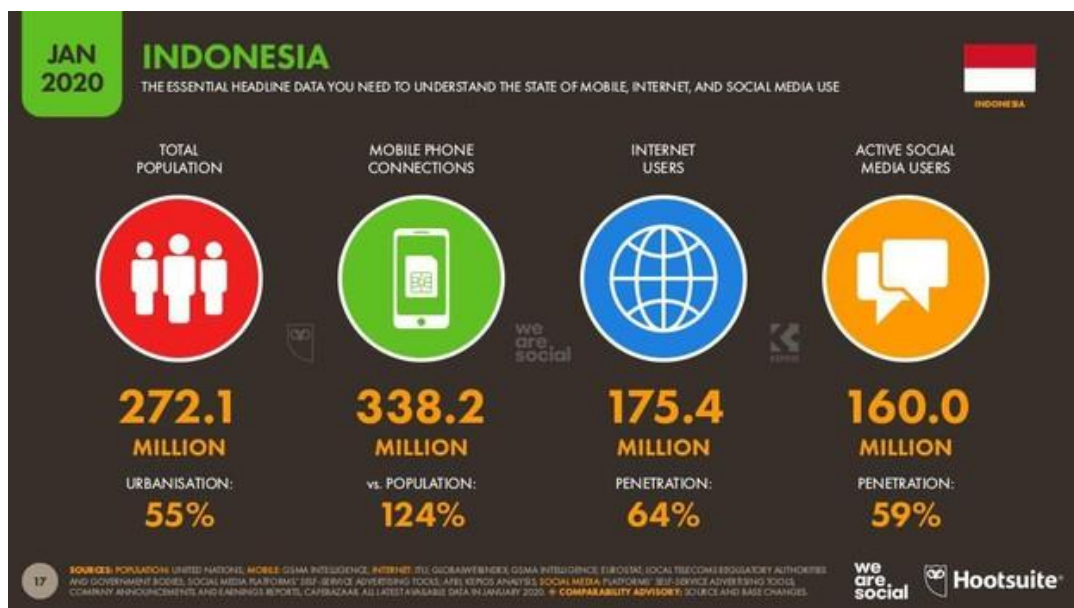
Gambar 1.1 Infografis Pengguna Internet di Indonesia

Indonesia dan masyarakatnya kini telah memasuki era digital dan informasi. Internet sudah menjadi gaya hidup yang tidak terpisahkan. Sebagian besar warga Indonesia pun telah memiliki akses pribadi ke internet, baik melalui telepon pintar ( smartphone ), komputer rumah/ PC ( Personal Computer ), laptop, tablet, atau gawai lainnya. Berdasarkan data dari We Are Social yang dapat dilihat di Gambar 1.1 di bawah ini, pada Januari 2020 tercatat 64% penduduk Indonesia merupakan pengguna internet, dan sebagian besar dari mereka (59%) juga merupakan pengguna aktif media sosial.