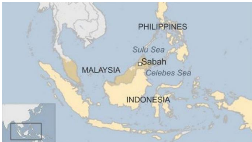
Gambar 4.1 Kawasan Laut Sulu dan Laut Sulawesi yang berada di Perbatasan Laut antara Indonesia, Malaysia dan Filipina

Indonesia, Malaysia dan Filipina adalah negara yang berada di Kawasan Asia Tenggara. Wilayah perbatasan laut antara Indonesia, Malaysia dan Filipina meliputi perairan Laut Sulu dan Laut Sulawesi. Perairan di Laut Sulawesi – Laut Sulu memiliki nilai strategis dan digunakan untuk kepentingan banyak negara. Ribuan armada tanker minyak dan armada dagang melintasi jalur tersebut setiap tahunnya (Rustam, 2017).