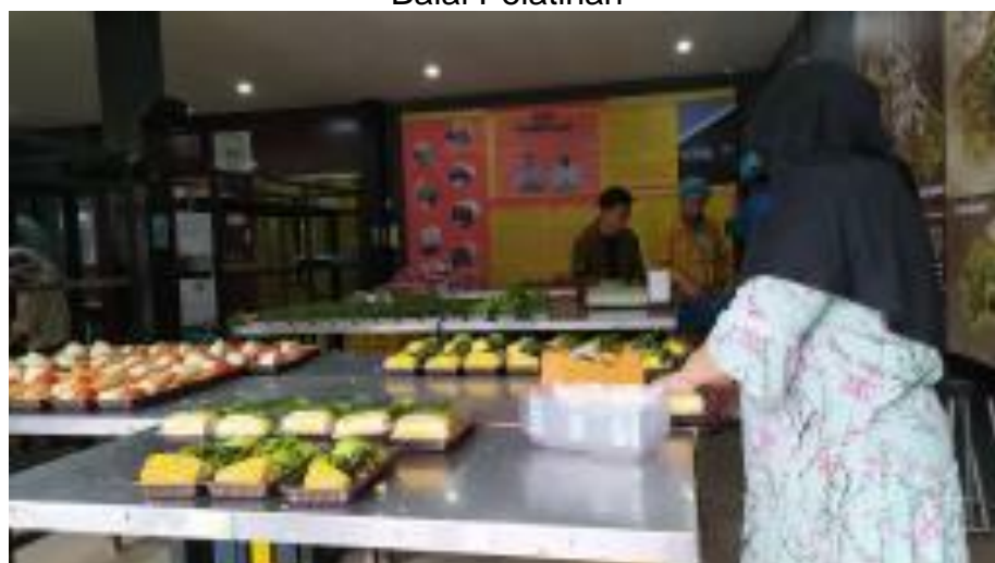
Pengemasan pengiriman Jakarta