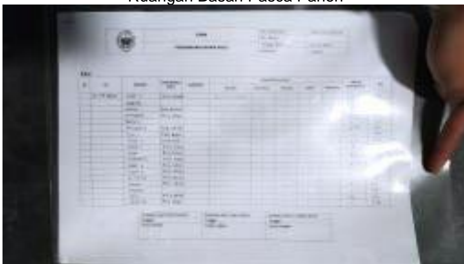
Pembagian tugas santri