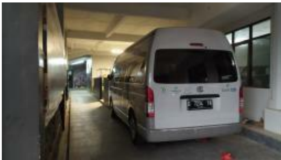
Ambulance Pondok Pesantren Al-Ittifaq