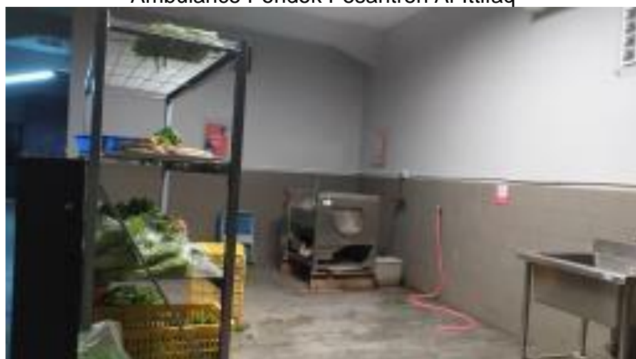
Ruangan Basah Pasca Panen