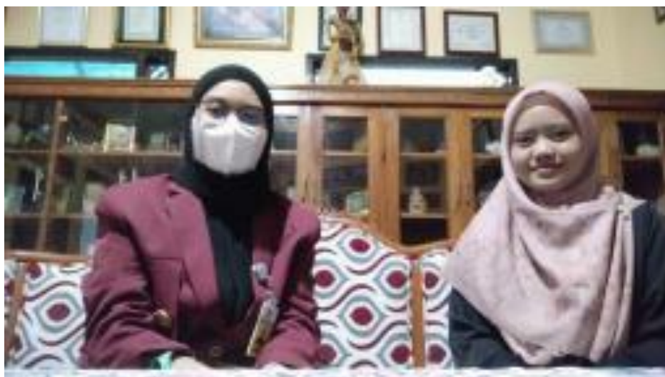
Bendahara Koperasi Pondok Pesantren Al-Ittifaq