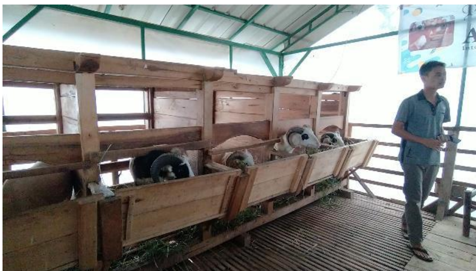
Peternakan domba Al-Ittifaq