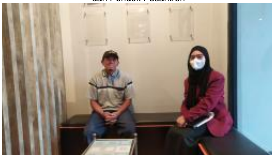
Santri Alumni Pondok Pesantren Al-Ittifaq