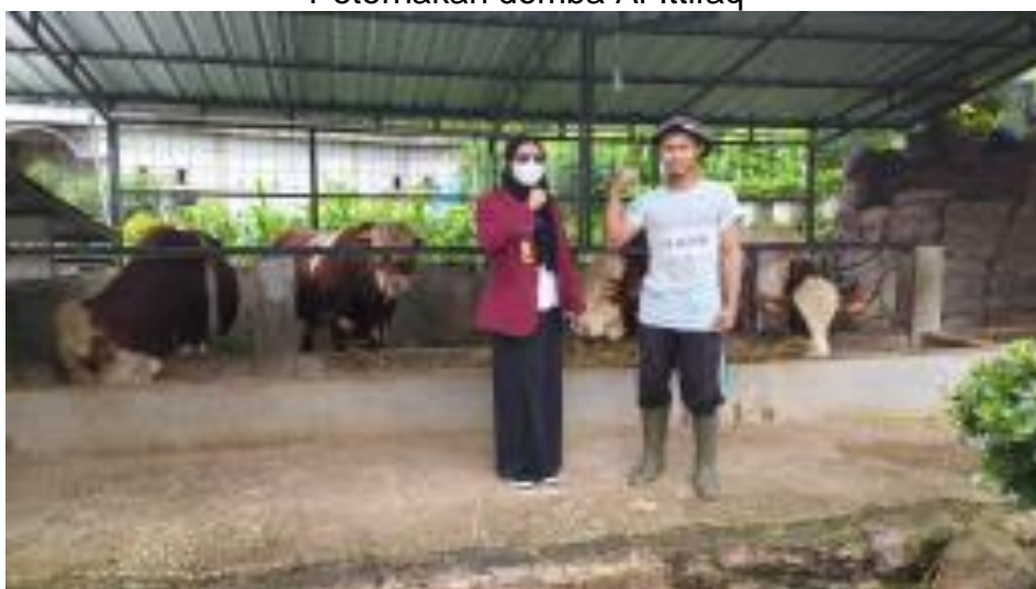
Peternakan sapi potong Al-Ittifaq