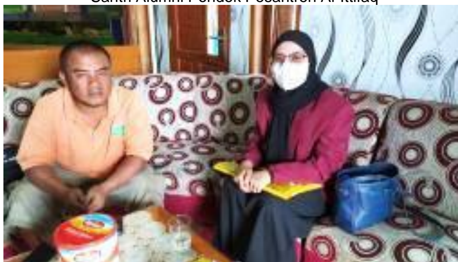
Ketua Kelompok Petani Al-Ittifaq