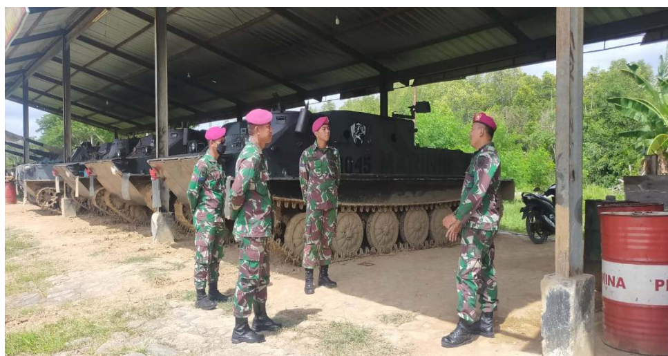
Wawancara dengan Informan D2 di Brigif 4-Mar/BS Lampung Pada tanggal 28 Oktober 2021