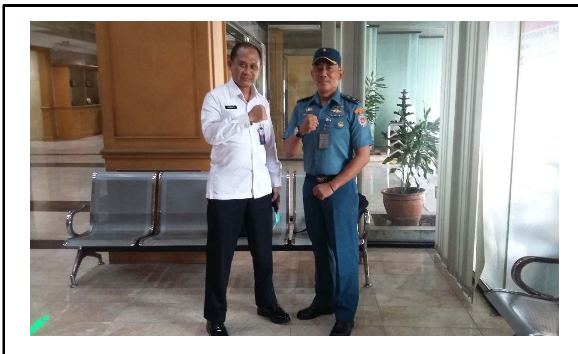
Wawancara dengan Informan B1 di KKIP Pada tanggal 11 Oktober 2021