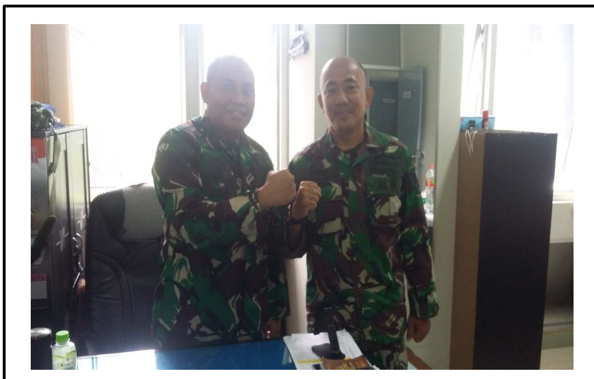
Wawancara dengan Informan C2 di Kormar Jl. Kwitang Pada tanggal 20 Oktober 2021