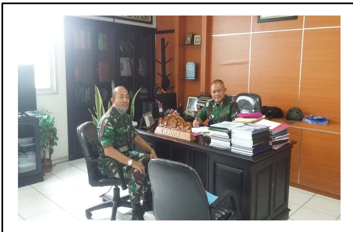
Wawancara dengan Informan C1 di Kormar Jl. Kwitang Pada tanggal 25 Oktober 2021