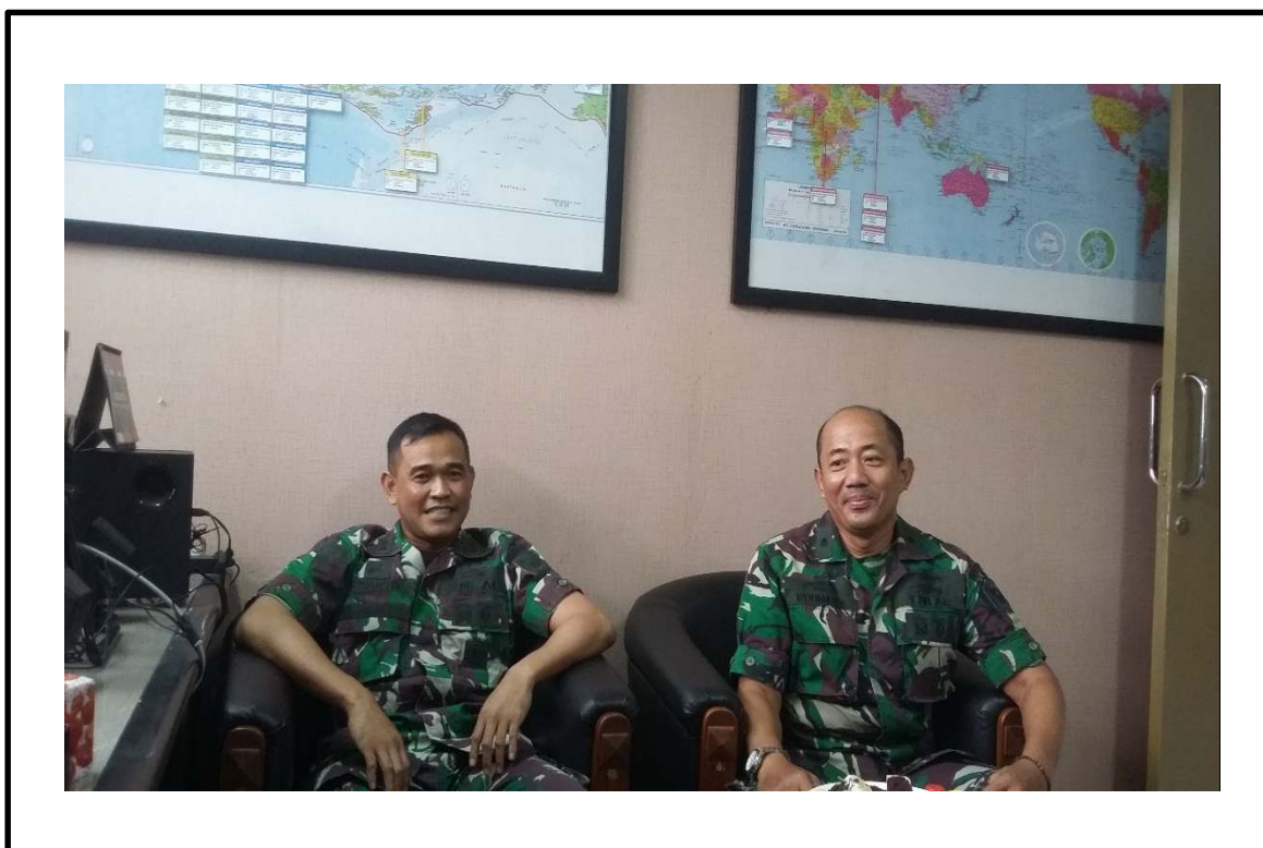
Wawancara dengan Informan D1 di Brigif 4-Mar/BS Lampung Pada tanggal 28 Oktober 2021