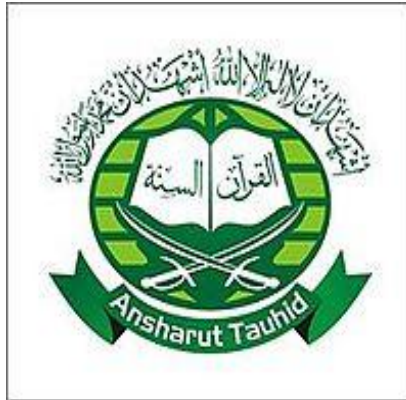
Gambar 4.1 Lambang Jamaah Anshorut Tauhid