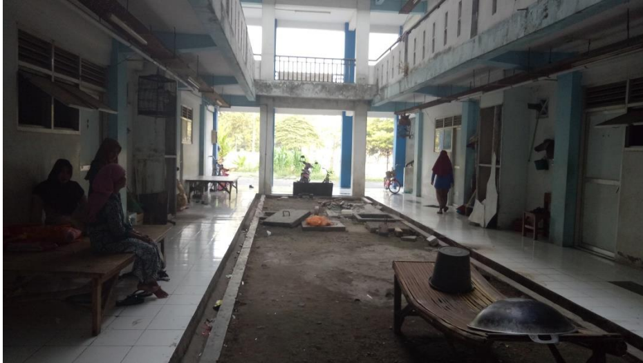
Gambar 4.4 Kondisi Rusunawa Pengungsi Syi'ah Sampang di Puspoagro, Jemundo, Kabupaten Sidoarjo

Selain itu membebaskan berbagai biaya selama berada di Rusunawa Puspoagro, Jemundo, Kabupaten Sidoarjo, Pemerintah Provinsi Jawa Timur berusaha meningkatkan kepercayaan pengungsi Syi'ah kepada Pemerintah Provinsi dalam penanganan konflik ini. Pemerintah Provinsi Jawa Timur terus melakukan pemenuhan pelayanan publik yang menjadi hak dasar warga negara seperti pelayanan perekaman KTP-EL, Kartu Keluarga, (sebelumnya terhambat karena ada teknis perubahan nama dan keluarga warga yang menyulitkan pihak Pemerintah Desa, kecamatan dan Dispenduk Kabupaten Sampang), Pengurusan Sertifikat Tanah (Prona), Istbat nikah, pelayanan kesehatan, pelayanan pendidikan. Upaya rekonsiliasi juga perlahan mulai dilakukan oleh pemerintah provinsi, salah satu langkah untuk bertemunya / interaksi masyarakat antara masyarakat Sampang dengan kelompok Tajul Muluk, maka direncanakan akan diselenggarakan kegiatan isbat nikah. Jumlah pasangan yang mendaftarkan diri untuk melakukan isbath nikah sebanyak 360 pasangan dengan rincian 22 pasangan dari pengungsi kelompok Tajul Muluk di Jemundo dan 238 pasangan dari Desa Blu'uran Kecamatan Karang Penang serta 100 pasangan dari Desa Karanggayam (Daerah Konflik) dan selebihnya dari warga sekitar konflik, dengan tujuan agar tidak ada kecemburuan sosial antara pengungsi kelompok Tajul Muluk di