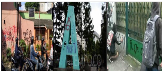
Gambar 1 Vandalisme di Kota Bandung pada Hari Buruh 2019

2019, aksi serupa terjadi dinyatakan dilakukan oleh aktor anarko sindikalisme. Namun demikian, aksi kekerasan justru terjadi pasca Konfederasi Serikat Pekerja Indonesia (KSPI) menegaskan pada tahun 2016 bahwa kalangan buruh tidak pernah melakukan aksi anarkis pasca 1 Mei ditetapkan sebagai hari libur nasional (Fardiansyah, 2016).